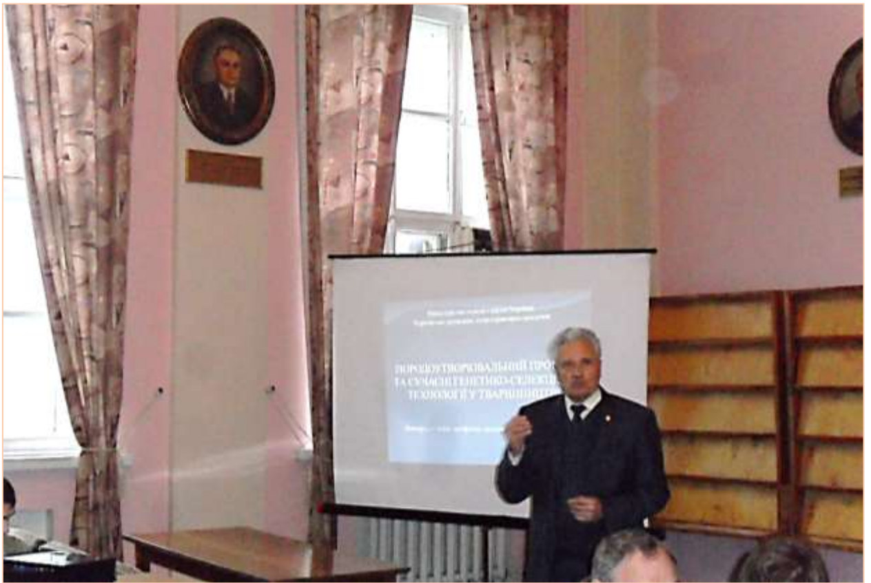
18 грудня 2018 року. Виступ на науково-практичній конференції «100-річчя Національної академії наук України» в Харківській державній зооветеринарній академії