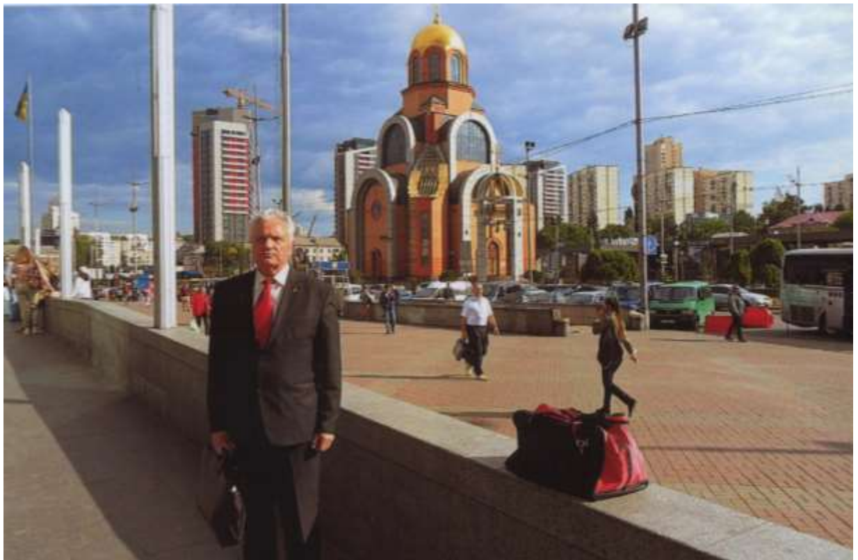
15 червня 2017. Київ, Вокзальна площа