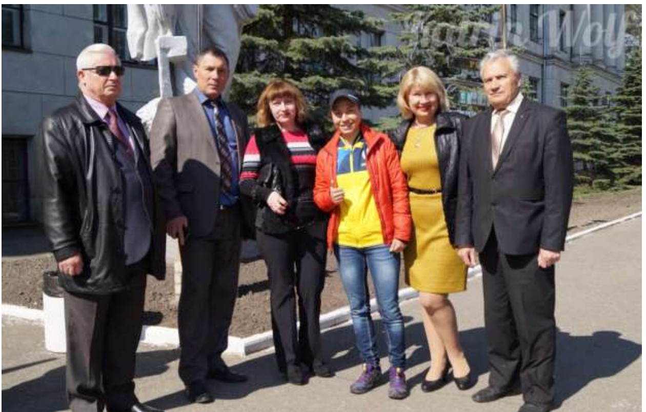
21.04.2018 День відкритих дверей