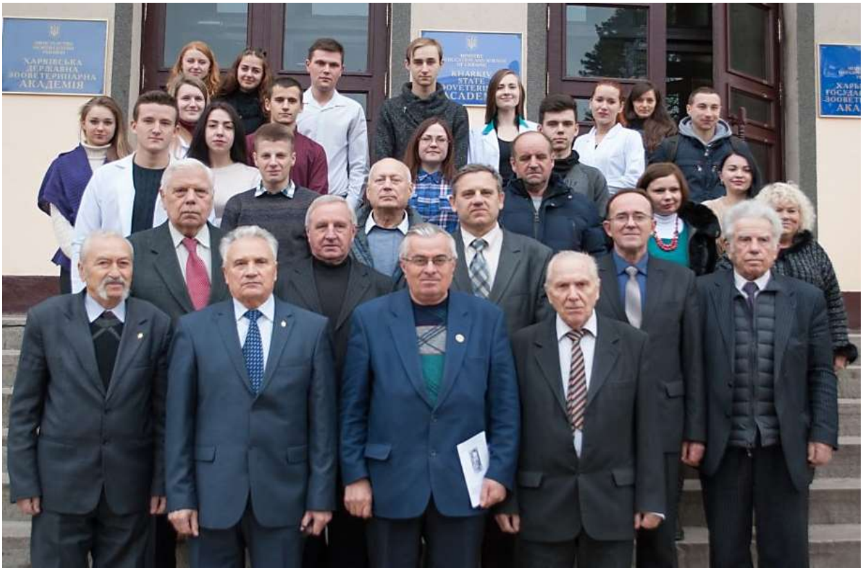
22.11.2017. Науково-практична конференція «З проблем еволюції, доместикації, генетики, селекції та біотехнології в тваринництві» присвячена 130-річчю від дня народження видатного вченого генетика та селекціонера академіка М. І. Вавилова з міжнародною участю.