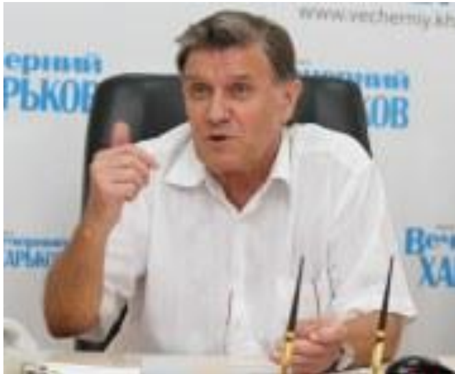
Гість «Прямої телефонної лінії». Газета «Вечірній Харків», 2010 р.