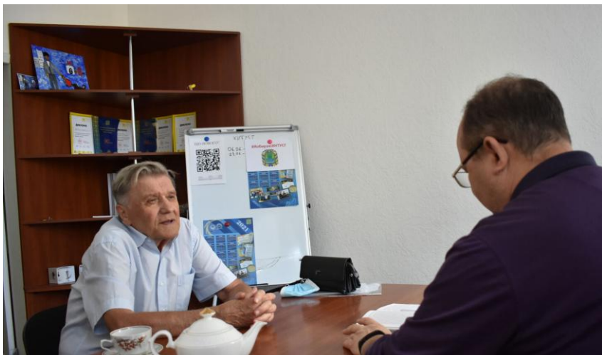
У відділі медіакомунікацій ХНТУСГ, 2021