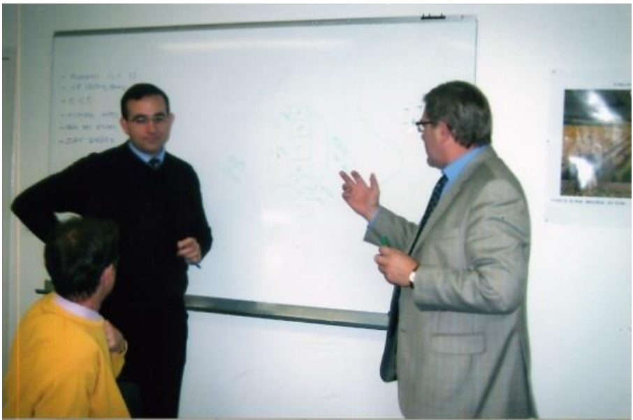
Дискусія з колегами в університеті АНЖЕ (Франція)