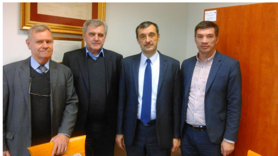
З Польськими друзями (Люблінський природничий університет)