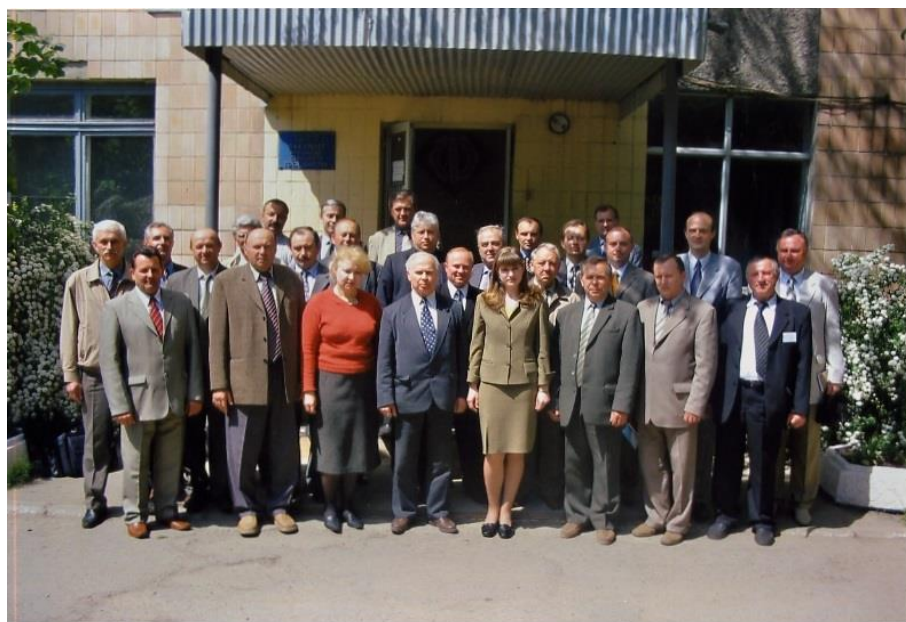
Деканами українських ЗВО