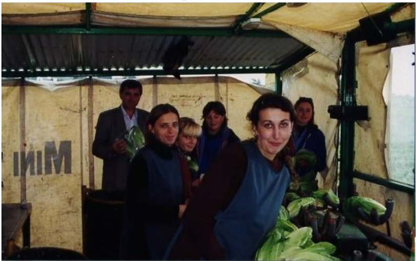
Наші практиканти найкращі (Велика Британія)