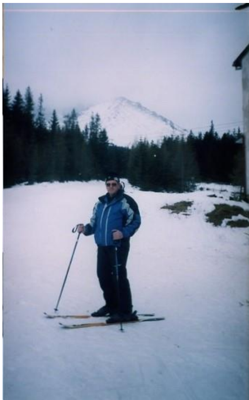
В Татрах (Словакія)