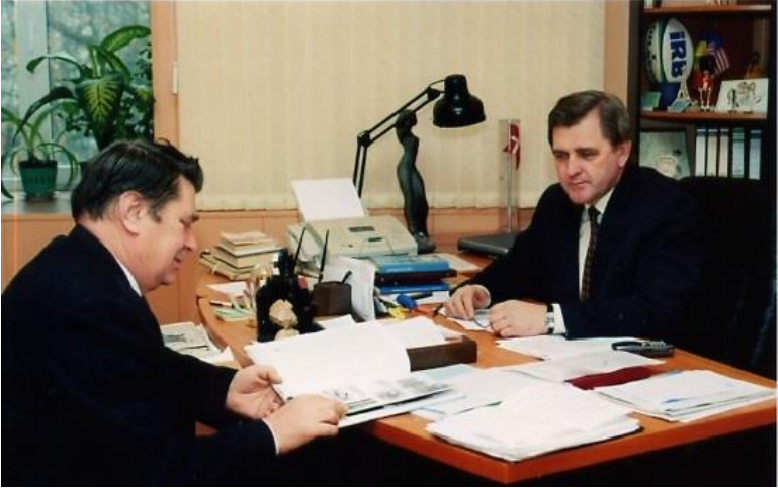
З науковим керівником