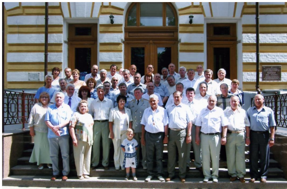
Зустріч одногрупників через 30 років