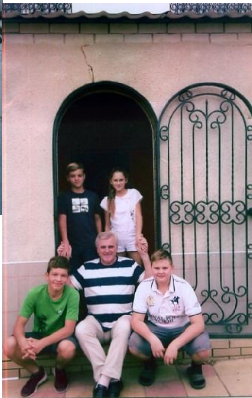
З рідними онуками