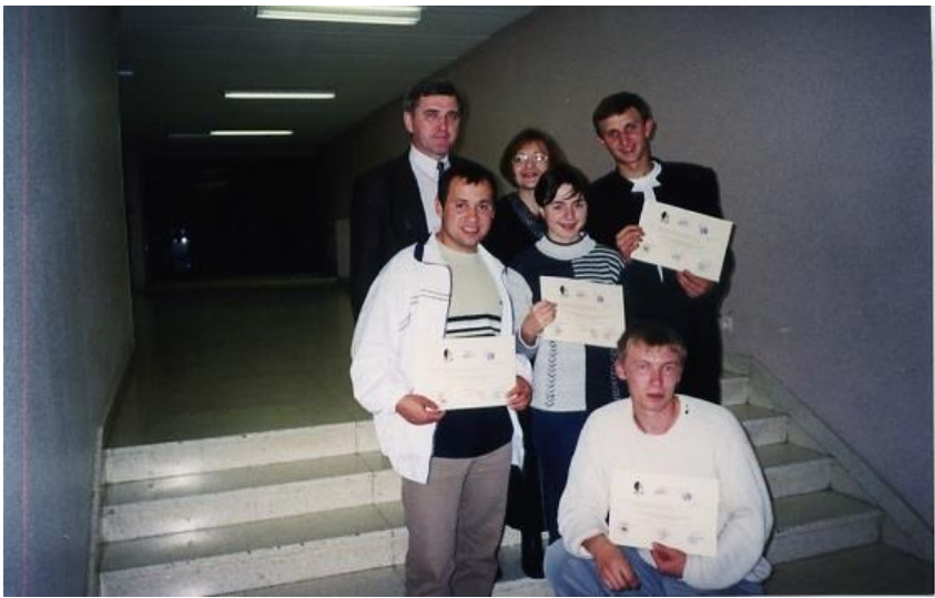
Наші практиканти успішно захистили звіти (Франція)