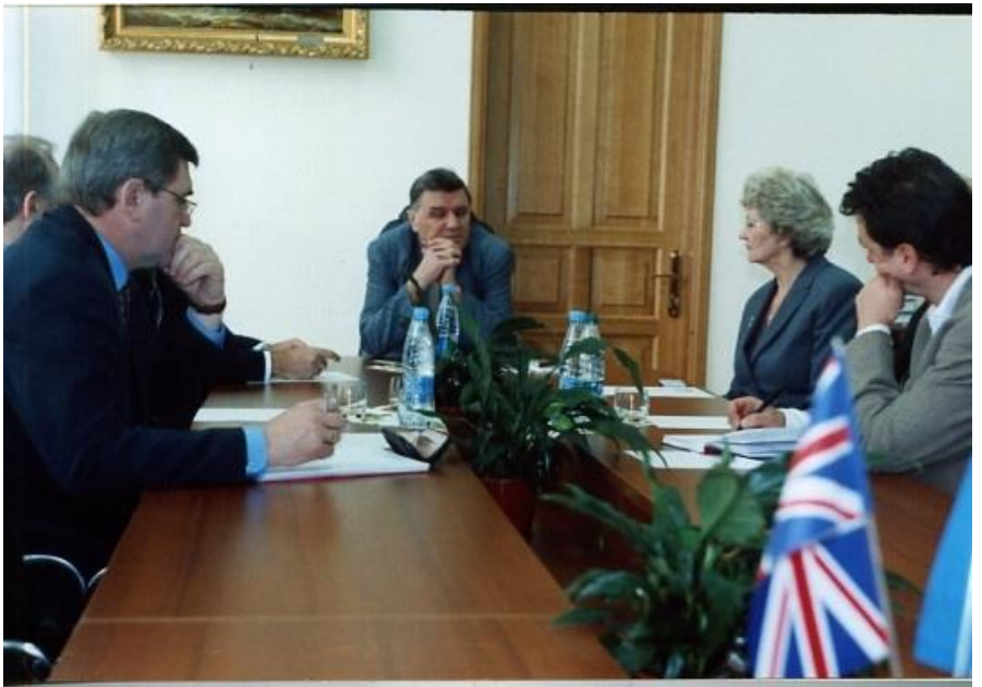
Ще одна міжнародна програма узгоджена (Велика Британія)