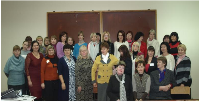
Всеукраїнська науково-практична конференція «Слобожанський гумантарій – 2015» Секція «Інноватика в бібліотеках вузів: ресурсне та інформаційне забезпечення науки і освіти» (до 85-річчя бібліотеки ХНТУСГ)