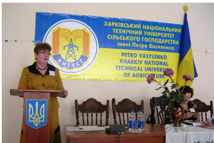
Міжнародна науково-практична конференція «Бібліотечно-інформаційний сервіс: сучасний стан і перспективи розвитку» (2010 р.)