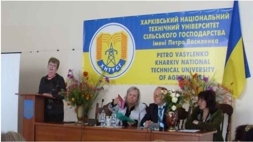
Міжнародна науково-практична конференція «Сучасні аспекти культурно-просвітницької та виховної роботи в бібліотеках ВНЗ» (2011 р.)