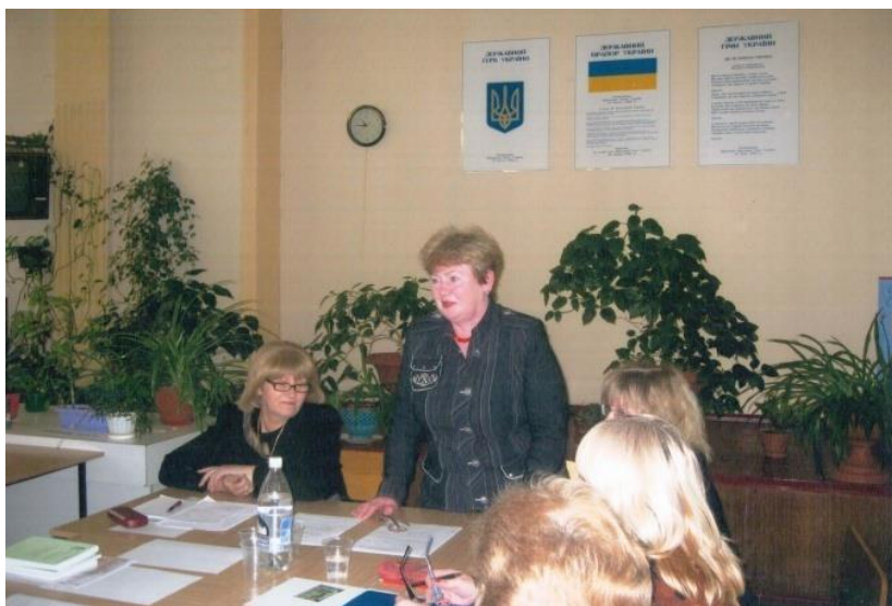
Науково-практичний семінар «Сільськогосподарські бібліотеки у соціокультурному просторі» (2008 р.)