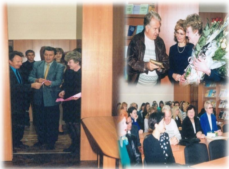
Урочисте відкриття читальної зали на вул. Артема, 44 (2002 р.)