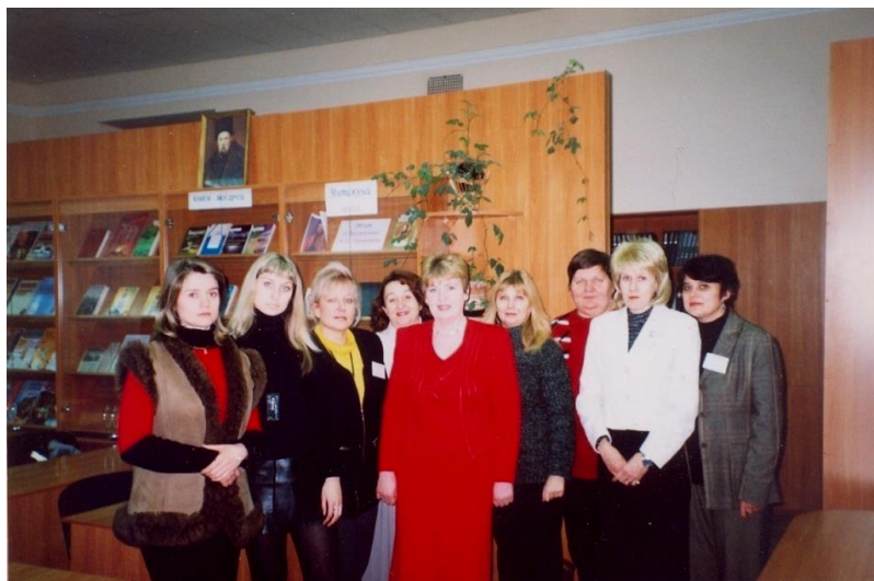
З колективом бібліотеки 2005 рік