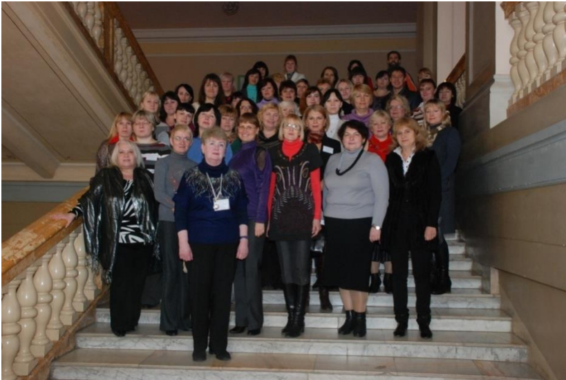
Міжнародна науково-практична конференція «Бібліотека ВНЗ: складові успішної діяльності» (2013 р.)