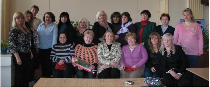
День бібліотек (2009 р.)