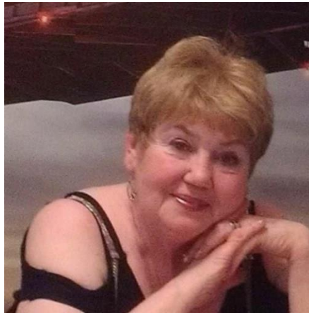
Тетяна Вікторівна на Facebook