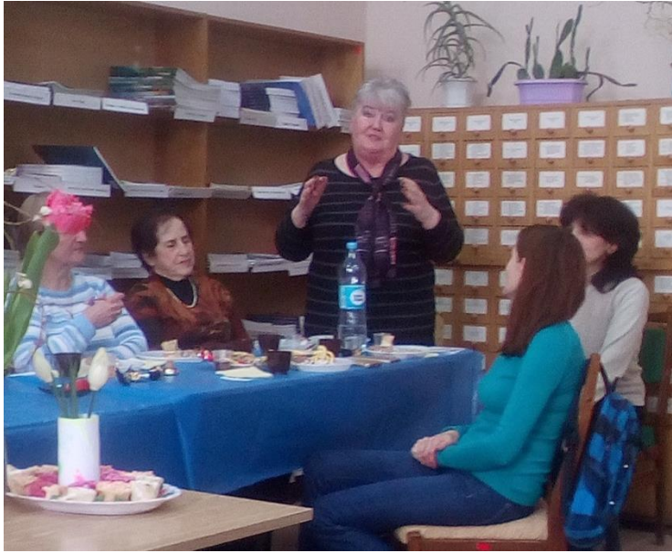
Свято 8 Березня в НБ ХНТУСГ (2019 р.)