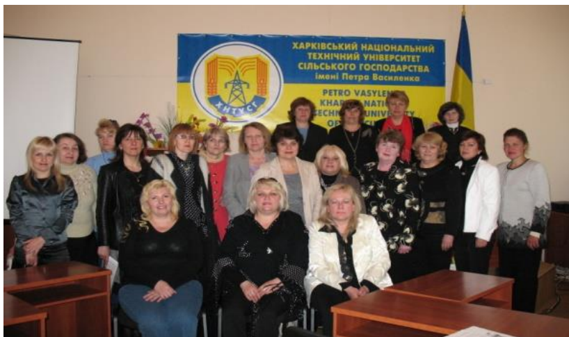
Науково-практичний семінар «Сучасні аспекти діяльності сільськогосподарських бібліотек» (2009 р.)