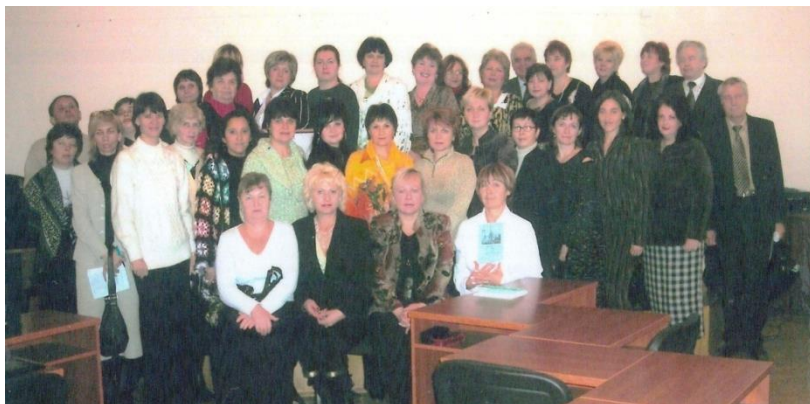
Науково-практична конференція «Інформаційно-культурна складова освіти: основні проблеми та перспективи у формуванні особистості» (2006 р.)