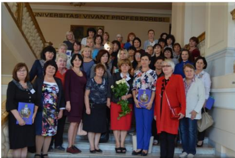
Науково-практична конференція «Бібліотека навчального закладу на новому етапі розвитку соціальних комунікацій» (2017 р.)