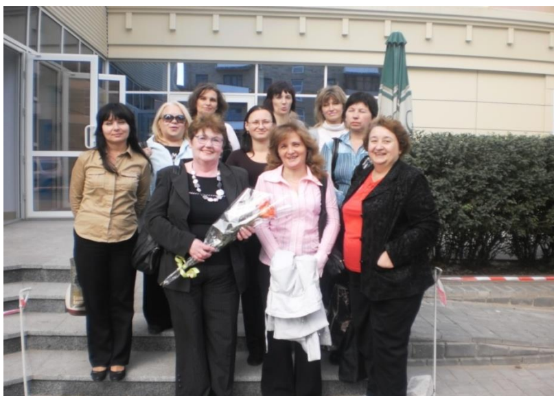
Свято «День бібліотек» (2014 р.)