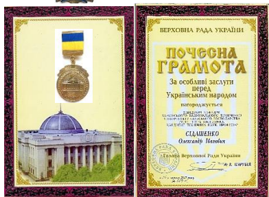
Почесна грамота Верховної Ради України за особливі заслуги перед Українським народом, 2017 р.