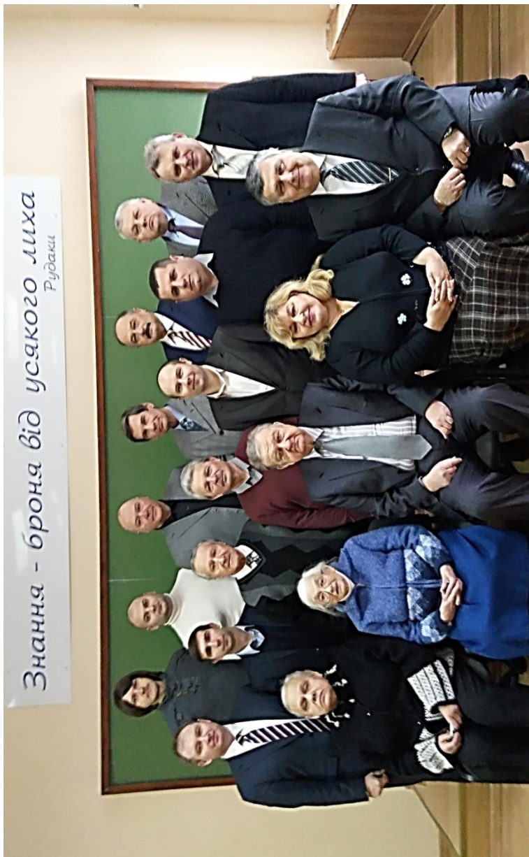
Кафедральна родина ТСРВ 2018 року