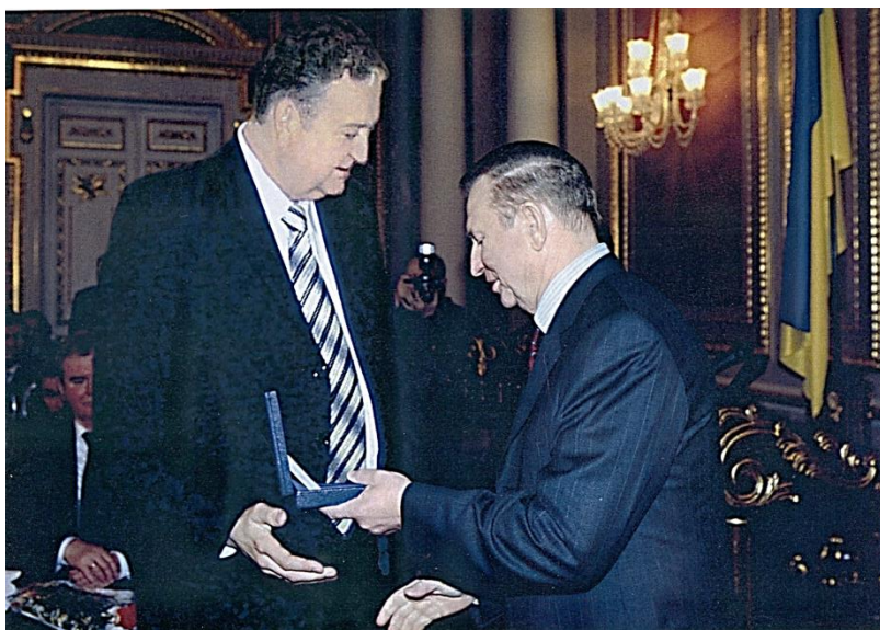
Вручення Державної премії України (1994 р.)