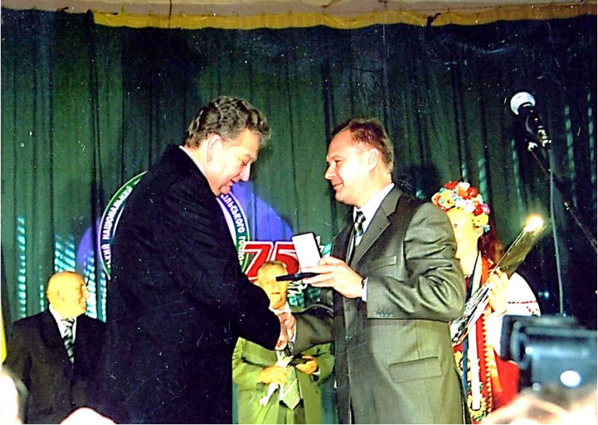
75 років університету, вручення почесної нагороди (2006 р.)