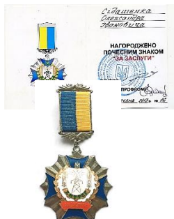
Почесний знак ХНТУСГ «За заслуги», 2016 р.