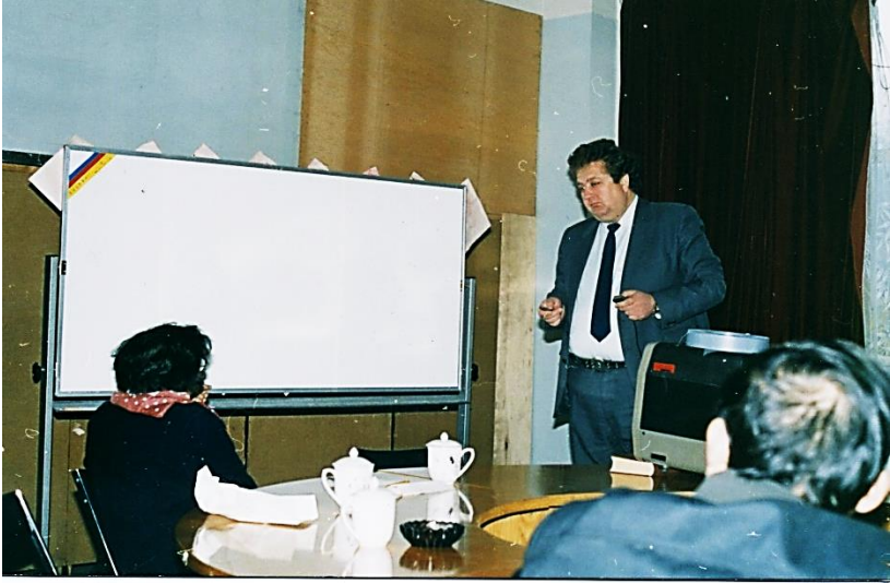
На лекції для викладачі університетів Китаю (1990 р.)