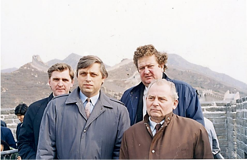
Делегація викладачів ХІМЕСГ у Китайській Народній республіці (1990р.).