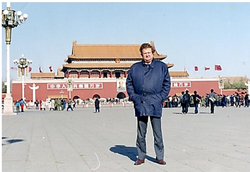
Мавзолей Великого кормчего (1990 р.)