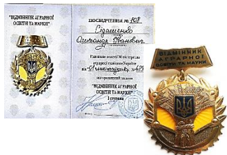
Відмінник аграрної освіти та науки, I ступеня, 2010 р.