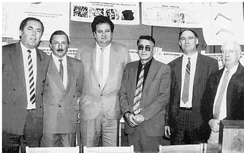
Після захисту дисертації аспірантом (м. Саратов, 1994 р.)