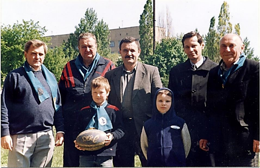
Після гри чемпіонату України з регбі -15 університетської команди «ТЕХ-А-С» (2004 р.)