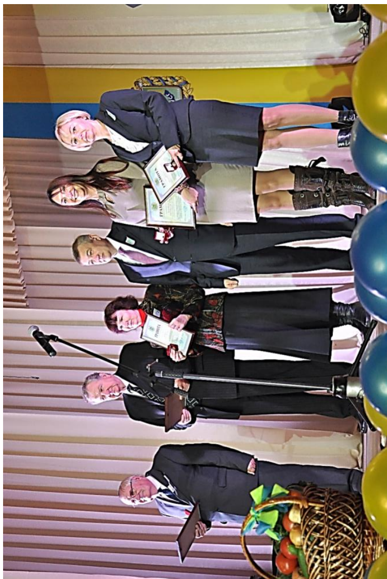
Спадкоємність поколінь. Учень нагороджує вчителя