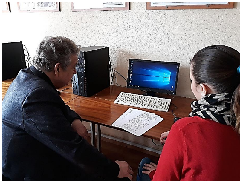
Робота з аспірантом (2018 р.)