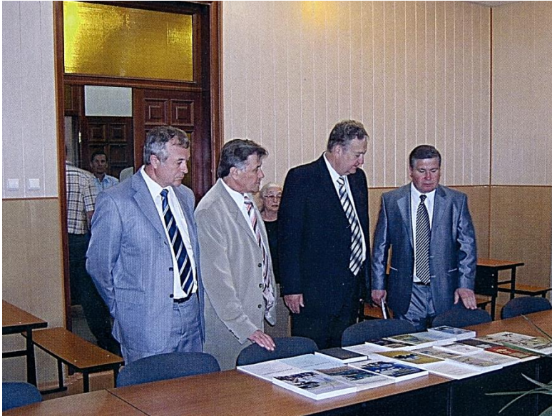
Звіт про досягнення перед представниками міністерства АПК (2008 р.)