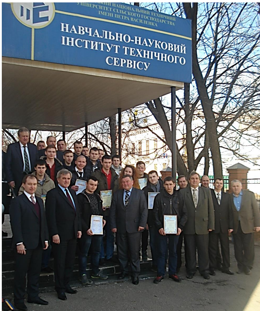
Фундатор та незмінний Голова журі Всеукраїнської олімпіади з дисципліни «Ремонт машин». В оточенні переможців олімпіади, колег та членів оргкомітету