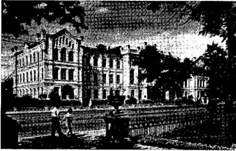
Будівля інституту на Московському проспекті, 45

У грудні 1933 року інституту передано Харківські машинно-тракторні майстерні з планом ремонту 250 тракторів, а також невеликий радгосп ім. Першого Травня в селищі Комарівка з площею земельних угідь 462 га, який став