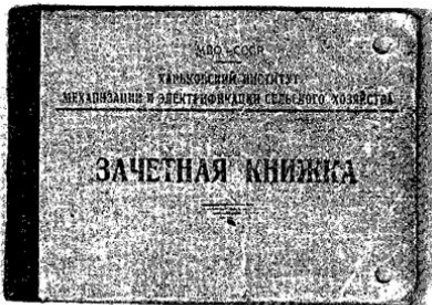
Залікова книжка студента, 1935 рік

Незважаючи на труднощі, продовжувалося зростання та розвиток інституту як провідного вищого навчального закладу галузі. У 1933 році було здійснено перший, достроковий випуск 28 студентів, який пройшов без захисту дипломних проектів. Перші інженери-механіки терміново були направлені до МТС, установ та організацій Харківської та інших областей України.