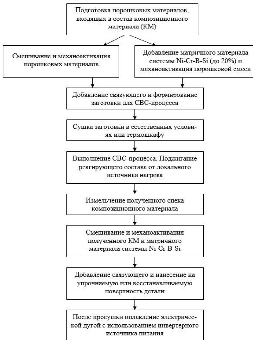
Рис. 1 – Алгоритм разработки технологии наплавки защитных покрытий, модифицированных износостойкими композиционными материалами, полученными с применением CVC-процесса

планетарних шарових мельницях досягає 60G, що дозволяє за кілька секунд отримати суттєві зміни розмірів частинок в оброблюваних матеріалах.