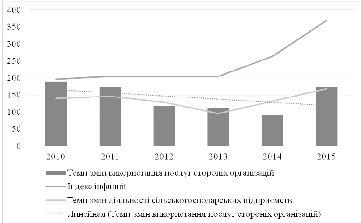
Рис. 2. Динаміка зміни використання послуг у сільськогосподарських підприємствах Харківської області

становить 0,74, що свідчить про високий зв'язок між даними ознаками. Коефіцієнт детермінації становив 55,1 %, а це означає, що витрати на послуги надані сторонніми підприємствами на 55,1 % залежать від рівня інфляції та рівня виробництва, а на 54,9 % від інших факторів.