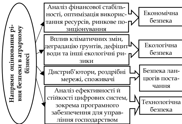
Рис. 2. Напрями оцінювання рівня безпеки в аграрному бізнесі