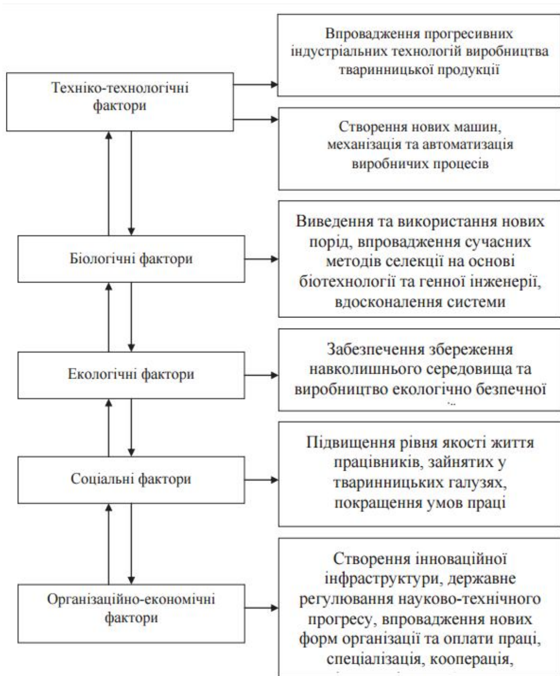
Рис. 2. Інноваційні фактори підвищення соціально-економічної ефективності галузі скотарства*