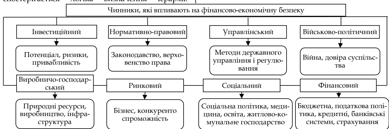
Рис. 1. Чинники, які впливають на фінансово-економічну безпеку країни

До наведених чинників можна додати і список загроз, які визначені Стратегією економічної безпеки України на період до 2025 року, затвердженою Указом Президента України від 11 серпня 2021 р. № 347/2021. Стратегія економічної безпеки, крім того, спрямована на забезпечення протидії викликам та загрозам економічної безпеки у фінансовій сфері [8].