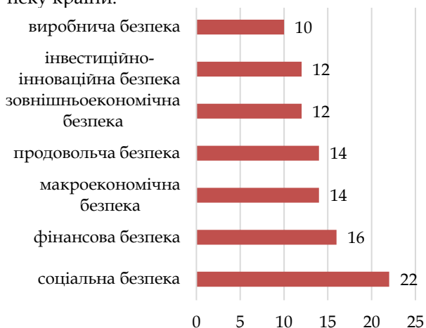
Рис. 2. Виклики і загрози економічній безпеці за складовими частинами, у % [1]

В експертному дослідженні, підготовленому Національним інститутом стратегічних досліджень (НІСД), представлено експертне дослідження ризиків виникнення загроз економічній безпеці України, які можуть реалізуватись в умовах війни. Зокрема, в рамках проведеного експертного опитування було актуалізовано, визначено та оцінено 50 загроз за складовими частинами: макроекономічна, фінансова, інвестиційно-інноваційна, виробнича, зовнішньоекономічна, соціальна та продовольча безпеки, визначених Стратегією економічної безпеки [1]. Результати експертної думки наведено на рис. 2, що дозволяють визначити вплив війни на економічну безпеку країни.