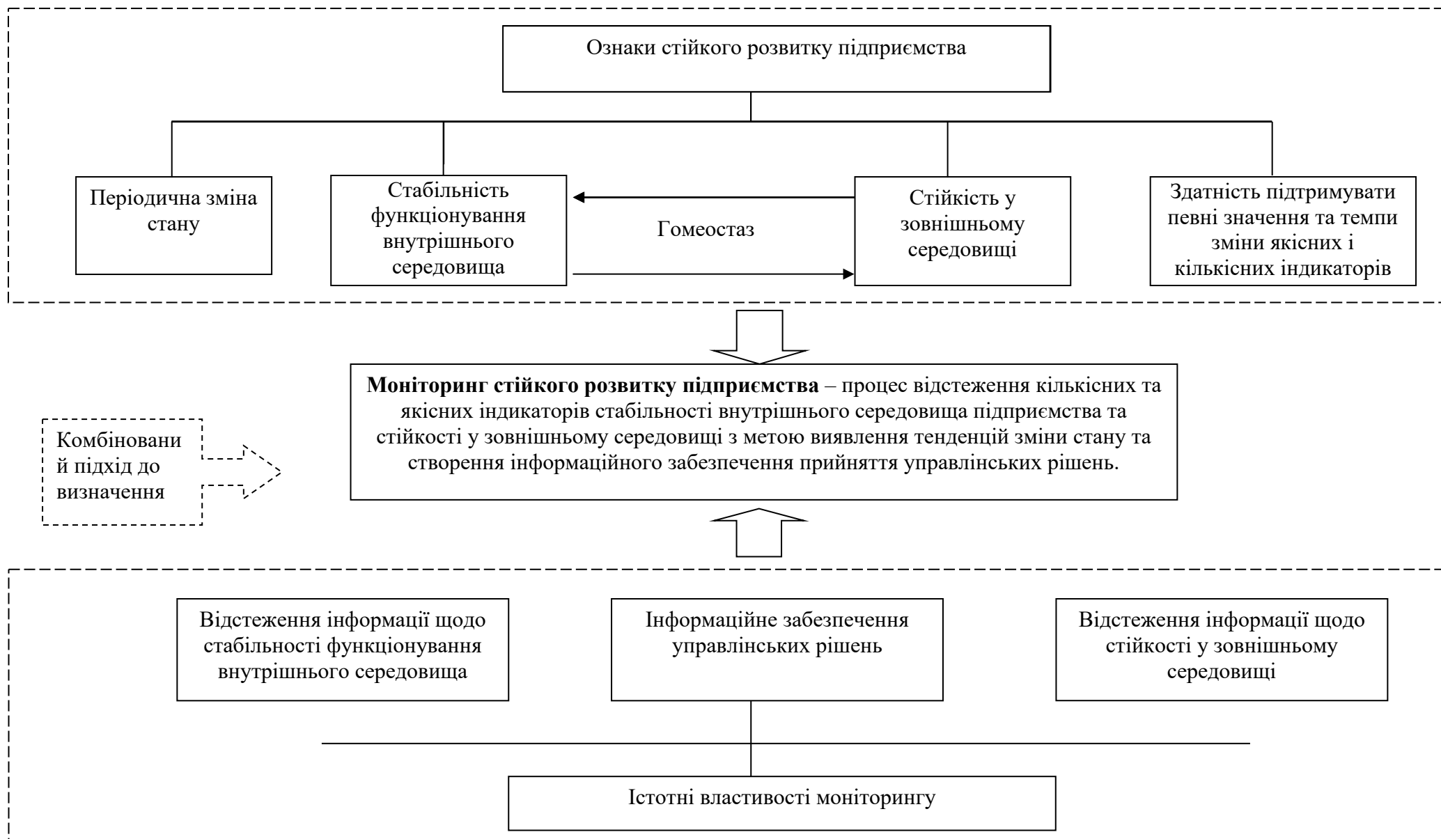
Рис. 1 - Логічні елементи визначення поняття «моніторинг стійкого розвитку підприємства»