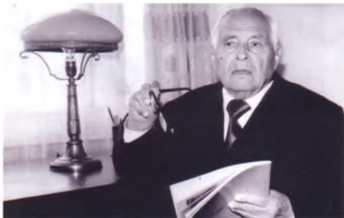
Рис. 4 – Академік П. М. Василенко. Пора мудрості. Середина 1990-х років

Незмінний успіх мали його традиційні регулярні наукові семінари, які збирали довкола П. М. Василенка не лише співробітників кафедри, але й представників інших кафедр, закладів освіти і науки.