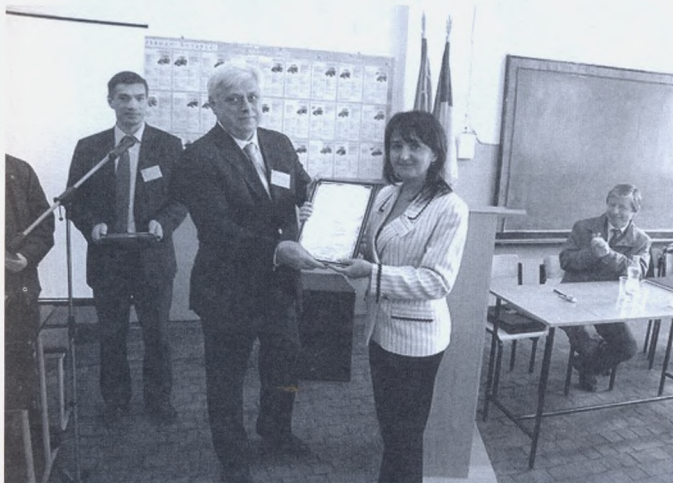
Вручення Подяки колективу Департаменту агропромислового розвитку ХОДА

Для визначення практичних знань та умінь у рамках освітньо-кваліфікаційного рівня "бакалавр" та "молодший спеціаліст" колективом ННІ МСМ розроблені відповідні конкурси та правила їх проведення, які заздалегідь розміщені на сайті mtf.khntusg.com.ua .