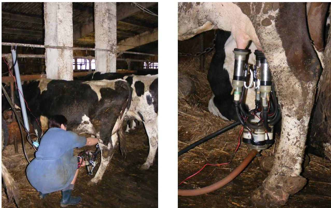
Рисунок 2 - Общий вид переносного манипулятора доения коров

пневмоклапан; 22 – геркон; 23 – электропневмоклапан; 24 – трубопровод; 25 – рычаг