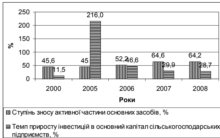
Рис. 2. Динаміка ступеня зносу активної частини основних засобів та темпу приросту інвестицій в основний капітал сільськогосподарських підприємств*