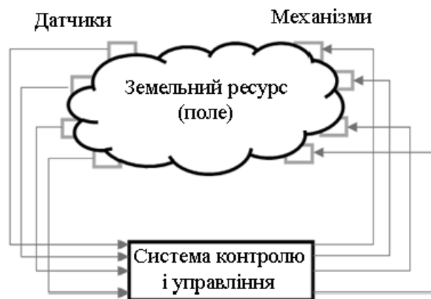
Рисунок 3 – Взаємодія інформаційної технології з полем

Спрощена структурна схема взаємодії інформаційної технології і землеробства представлена на рисунку 3.