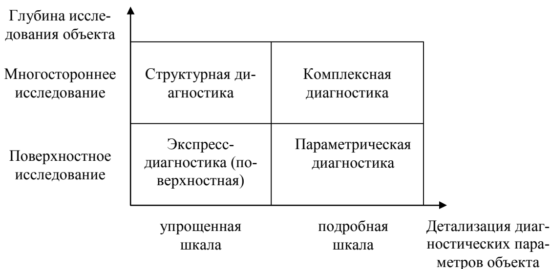
Рисунок 1 – Виды диагностики систем транспорта в зависимости от глубины исследования и детализации диагностических параметров объекта диагностирования (предлагается)

В начале исследования предлагается выделить основные виды диагностики систем транспорта в зависимости от детализации диагностических параметров объектов диагностирования и глубины исследования объектов – рис. 1. Признак «поверхностное исследование» подразумевает рассмотрение одного или нескольких свойств объекта диагностирования. Примером упрощенной и подробной шкалы детализации диагностических параметров могут служить критерии оценки в системе образования: упрощенная шкала – «удовлетворительно», «неудовлетворительно»; подробная шкала – «отлично», «хорошо», «удовлетворительно», «неудовлетворительно».