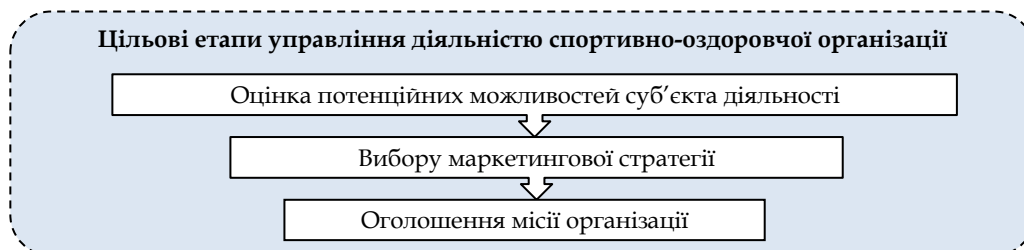
Рис. 2. Етапи управління діяльністю спортивно-оздоровчої сфери на рівні організації

Етапи управління діяльністю спортивно-оздоровчої сфери на рівні організації наведено на рис. 2.