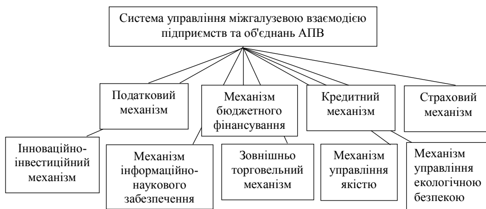
Рис. 2. Структура системи управління міжгалузевою взаємодією підприємств та об'єднань агропромислового виробництва

В дисертації обґрунтовано типологію механізмів, які входять до системи управління міжгалузевою взаємодією підприємств і об'єднань агропромислового виробництва (рис. 2). Елементи механізму управління міжгалузевою взаємодією підприємств та об'єднань агропромислового виробництва у своїй сукупності дозволяють підприємствам оптимізувати систему міжгалузевих взаємовідносин, що сприяє еквівалентності обміну товарами та ресурсами.