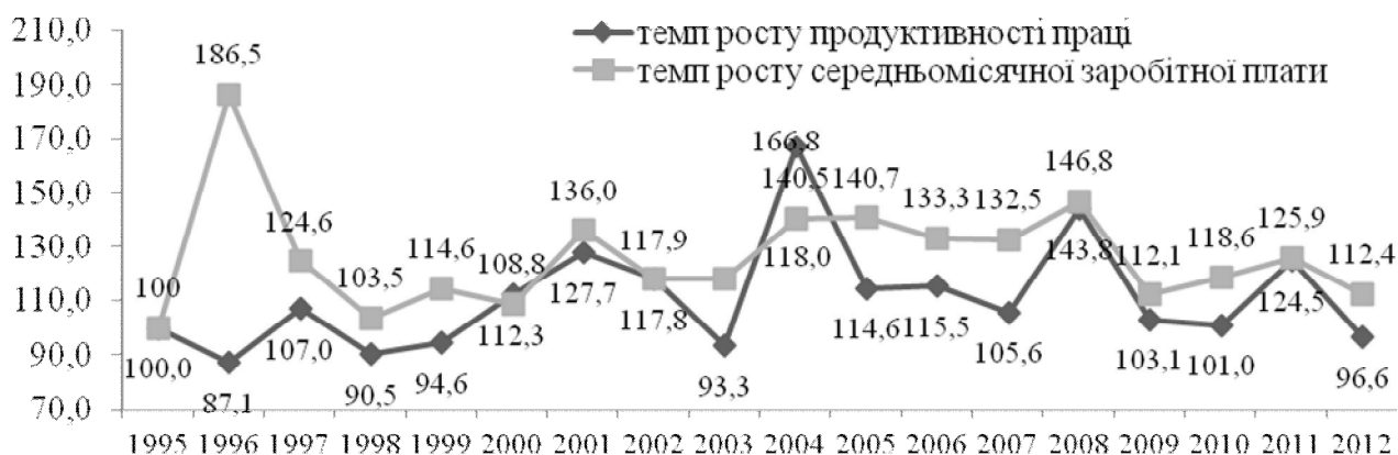
Рис.1. Динаміка темпів росту продуктивності праці та заробітної плати в галузі сільського господарства України

На рис. 1 представлена динаміка індексів продуктивності праці та середньомісячної номінальної заробітної плати в галузі сільського господарства України за 1995-2012 рр., значення яких отримано ланцюговим способом на основі статистичних даних [18]. Продуктивність праці представлена рівнем продуктивності праці в сільськогосподарських підприємствах на одного зайнятого у сільськогосподарському виробництві, у постійних цінах 2010 р.