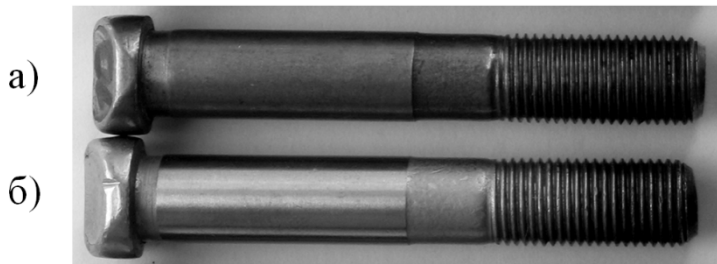
Рисунок 1 – Шатунні болти двигуна 3МЗ-406 у вихідному стані (а) та після ІБ (б)

Криві розтягання шатунних болтів у вихідному стані та після ІБ за двома режимами, представлені на рис. 2.