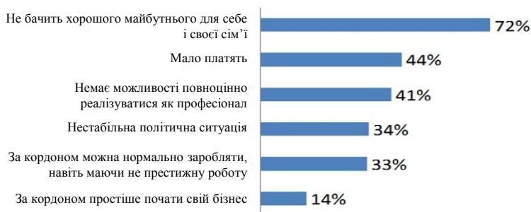
Рис. 3. Основні спонукальні мотиви міграції молоді з України [4]