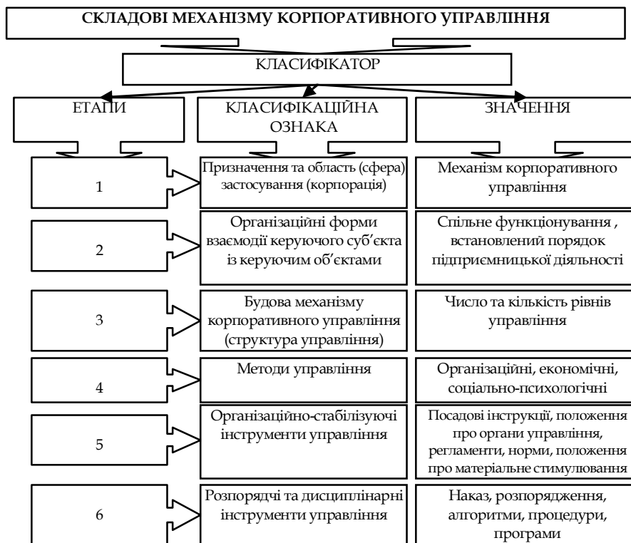
Рис. 1. Класифікатор складових механізму корпоративного управління

Однією з умов системного підходу дослідження будь-якого об'єкту є послідовна класифікація його складових. Проведені дослідження дозволяють здійснити класифікацію складових механізму корпоративного управління представлені на (рис. 1).