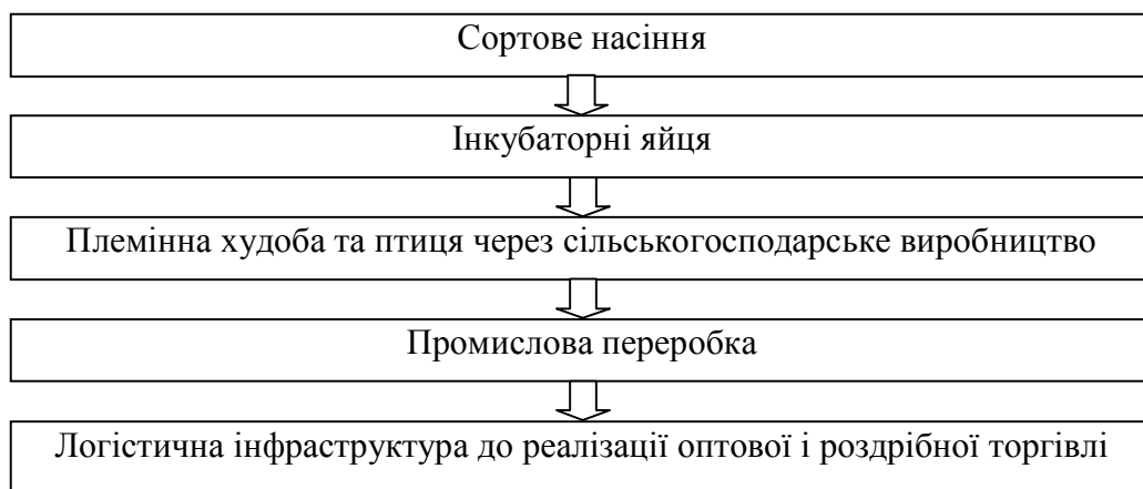
Рис. 3. Цикл виробництва сільськогосподарської продукції

При цьому слід зосередити основні зусилля на таких напрямках: