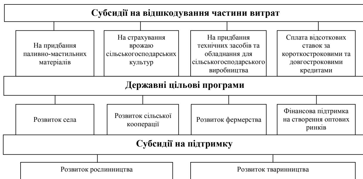
Рис. 2. Види державної підтримки в Україні [4]

Головними інструментами державної підтримки сільськогосподарських підприємств є дотації, субсидії, субвенції. Основні види державної підтримки в Україні наведено на рис. 2.