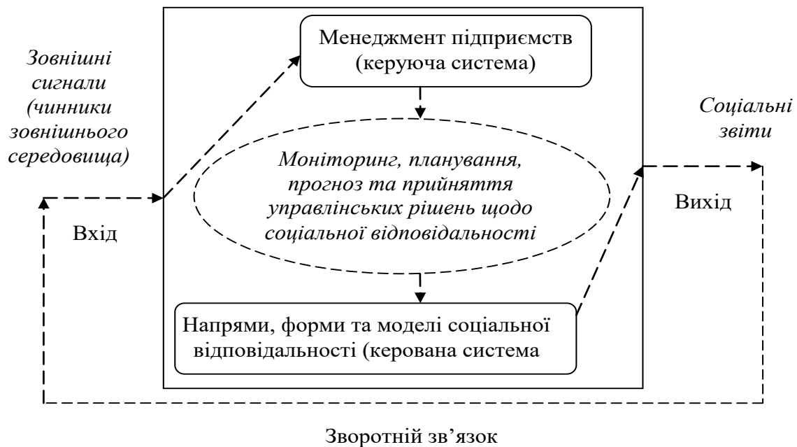
Рис. 2. Взаємозв'язок інформаційної складової механізмів соціальної відповідальності та зовнішнього середовища суб'єктів агробізнесу

який можна схематично зобразити (рис. 2) шляхом поєднання внутрішньої структури, яка виражається через відносини між керуючою та керованою системами, та зовнішнього оточення, до якої відносяться вхідні та вихідні сигнали, зворотній зв'язок між ними [9, с. 148]. Процес руху інформації між зовнішнім середовищем та системою управління соціальною відповідальністю аграрних підприємств на рис. 2 зображено пунктирними лініями.