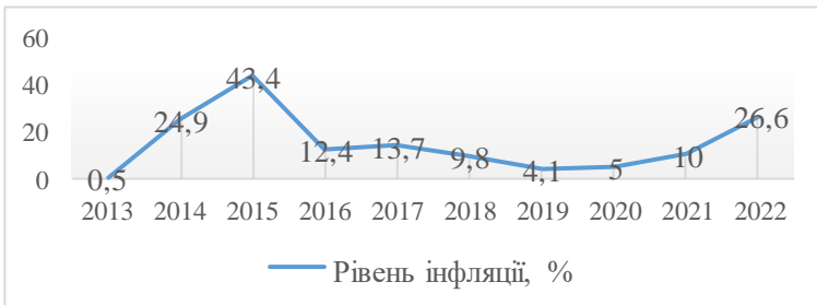
Рисунок 1 – Показники рівня інфляції в Україні впродовж 2013-2022 рр.

Останнім часом, з різкою зміною динаміки інфляційних показників у більшості країн світу виникла необхідність досліджувати це багатфакторне явище все більше. Інфляція має широкий вплив на економіку та суспільне життя, адже зростання цін, дефіцит товарів та знецінення грошової одиниці - це тільки деякі наслідки інфляційних процесів, які відчуває кожен з нас у своєму повсякденному житті. Наслідки зростання рівня інфляції у 2023 році в Україні можуть бути серйозними. Інфляція може привести до збільшення цін на товари та послуги, зниження купівельної спроможності громадян та погіршення їхнього рівня життя. Внаслідок цього може зрости соціальна напруженість, зменшитись рівень довіри до влади та виникнути інші негативні наслідки.