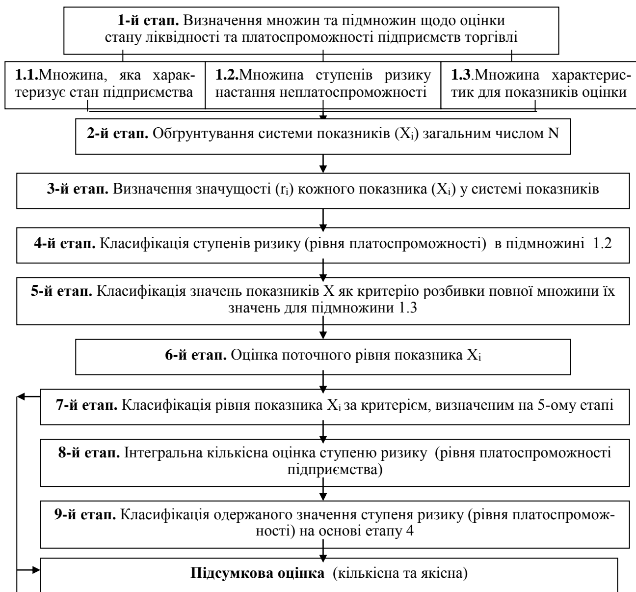
Рис. 3. Методика інтегральної оцінки рівня платоспроможності та ліквідності підприємств роздрібної торгівлі.

ного інтегрального показника в динаміці й у порівнянні з підприємствами аналогами; 4) виявляти найбільш вузькі місця в роботі підприємства й обґрунтовувати управлінські рішення щодо формування необхідного майбутнього рівня ліквідності та платоспроможності.