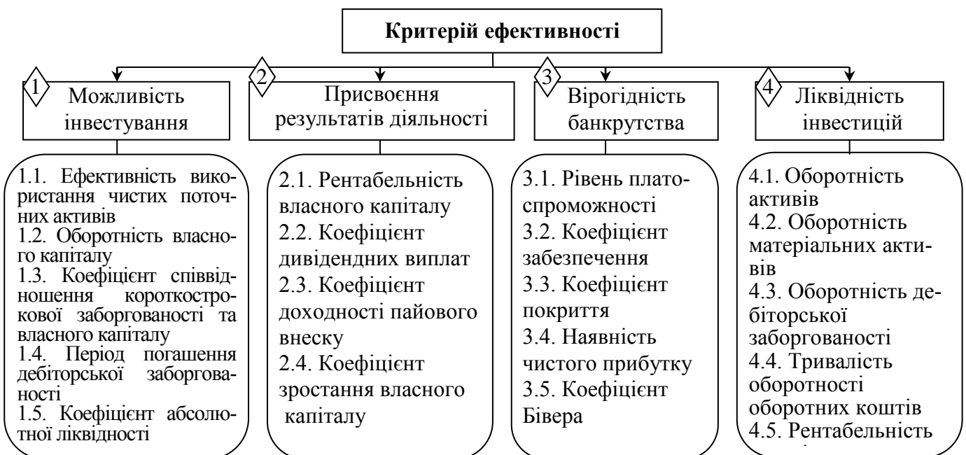
Рис.1. Система критеріїв та показників оцінки ефективності функціонування підприємств ресторанного господарства різних організаційно-правових форм

Враховуючи, що оцінка ефективності функціонування підприємств різних організаційно-правових форм має базуватись на системі критеріїв та показників, які формуються в площині фінансових аспектів діяльності суб'єкта господарювання, визначено основні критерії ефективності організаційно-правової форми підприємства: можливість інвестування, присвоєння результатів діяльності, вірогідність банкрутства, ліквідність інвестицій. Враховуючи основні методичні особливості здійснення оцінки ефективності функціонування суб'єктів господарювання, відповідно до обґрунтованих критеріїв, запропоновано систему показників оцінки ефективності функціонування підприємств ресторанного господарства певних організаційно-правових форм (рис. 1).