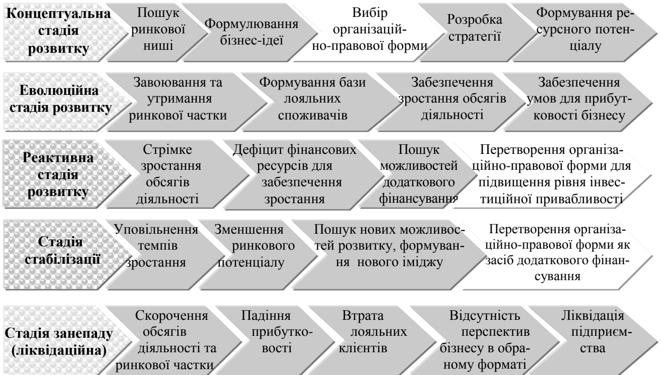
Рис.2. Обґрунтування необхідності перетворення організаційно-правової форми підприємства залежно від стадії його розвитку

туальній, еволюційній, реактивній, стабілізації та занепаду) і доведено, що проблема вибору організаційно-правової форми набуває особливої актуальності на етапі розробки концепції розвитку, підвищення інвестиційної привабливості під час реактивної стадії розвитку і залучення додаткового фінансування на стадії стабілізації (рис.2).