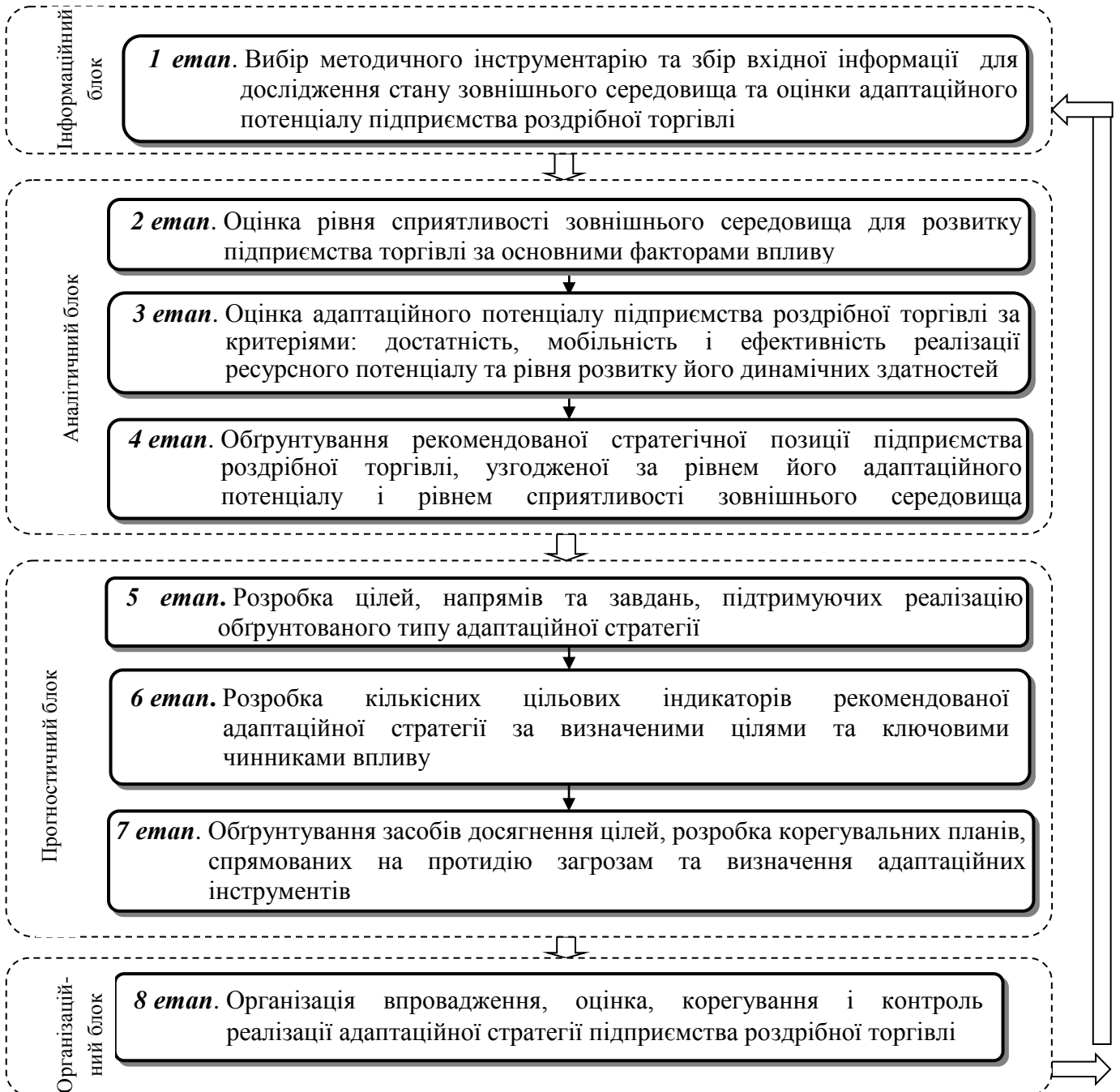
Рис. 2. Структурно-логічна схема процесу формування стратегії адаптації підприємств роздрібної торгівлі

Враховуючи необхідність забезпечення узгодженості адапційної стратегії зі станом зовнішнього середовища та наявними адапційними можливостями підприємства, у дисертації обґрунтовано доцільність використання інтегрованого підходу до формування стратегії адаптації підприємств роздрібної торгівлі (рис. 2), що поєднує в єдиний циклічний процес послідовність дій із розробки стратегії та базується на системі індикаторів за визначеними цілями та ключовими чинниками впливу.