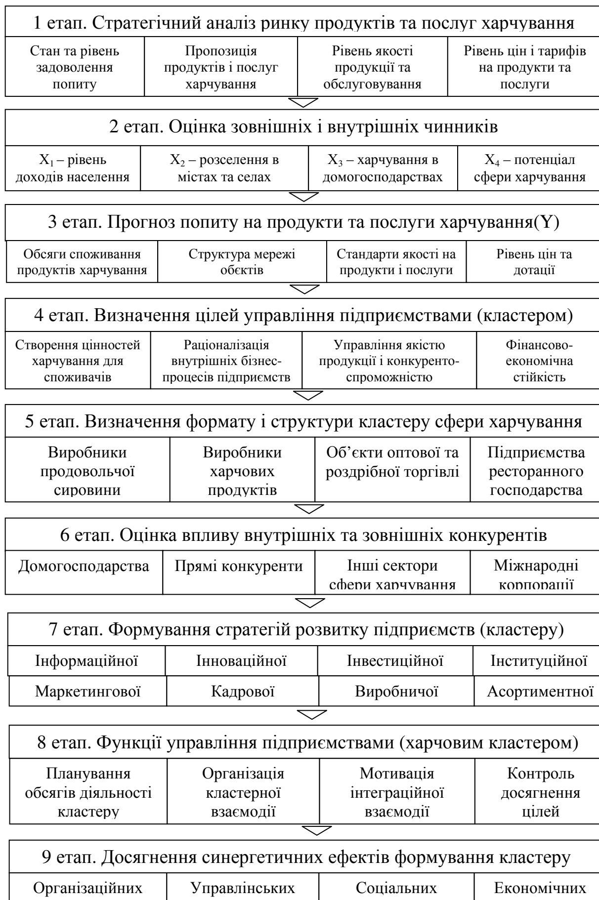
Рис. 5. Проектування процесу управління підприємствами та кластерами сфери харчування