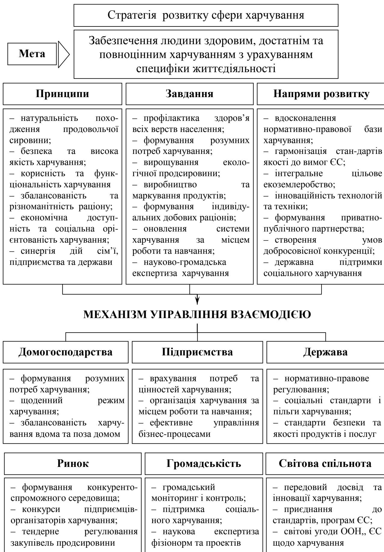
Рис. 4. Стратегія розвитку сфери харчування