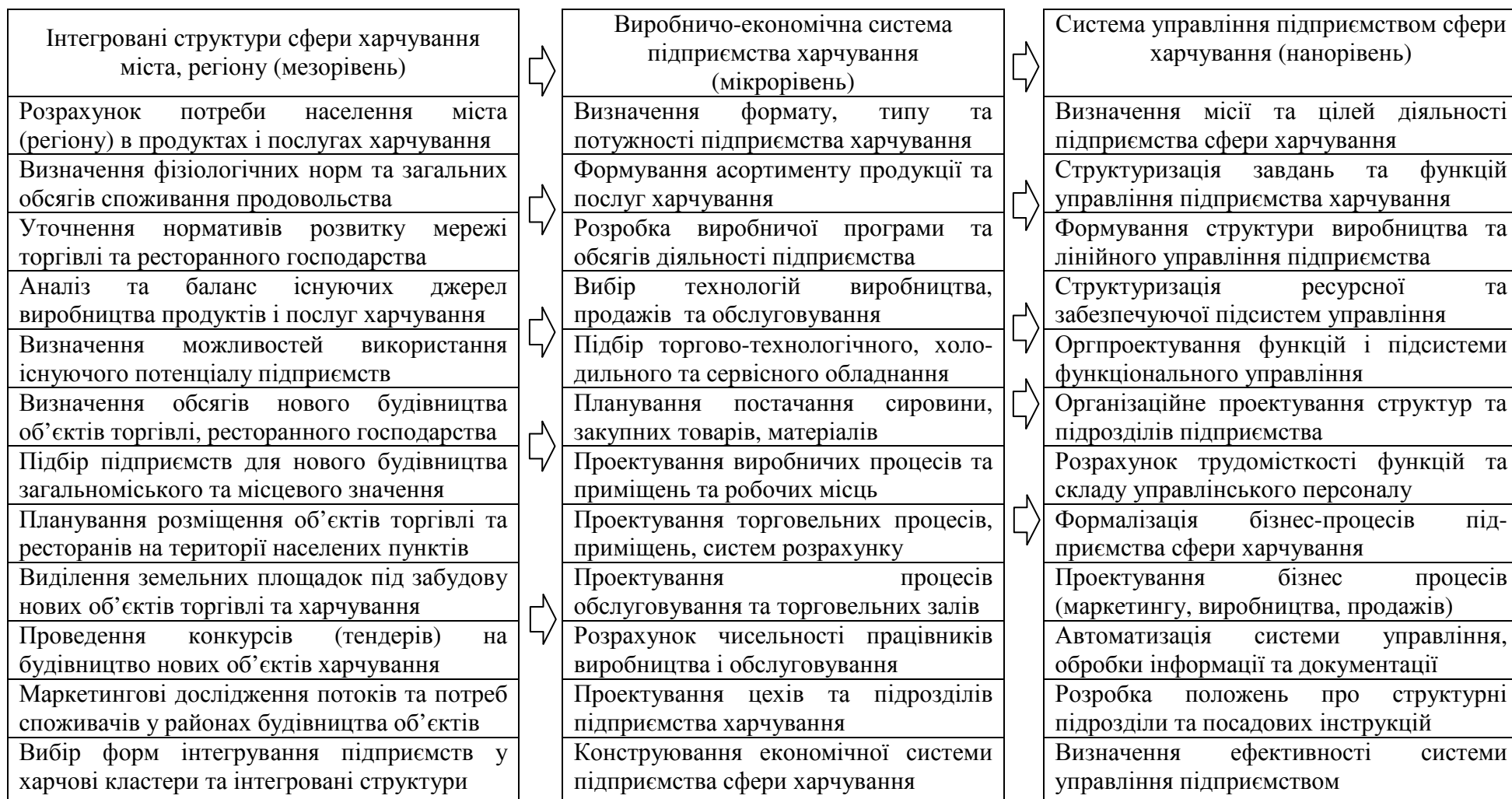
Рис. 6. Етапи інтегрованого управління підприємствами сфери харчування.