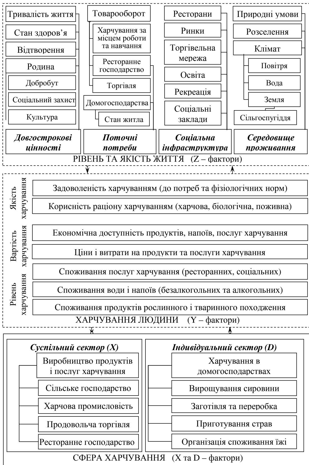
Рис. 1. Сфера харчування в системі чинників якості життя населення