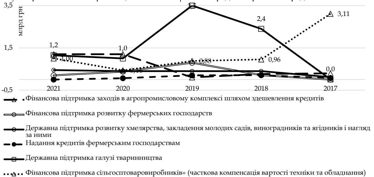
Рис. 1. Державна підтримка агропромислового комплексу в динаміці

державну підтримку зрошення – по 100 млн грн; на державну підтримку розвитку картоплярства – 60 млн грн. Особливої уваги вартує такий інструмент як пільгове кредитування суб'єктів АПК для погашення короткострокових і середньострокових кредитів.