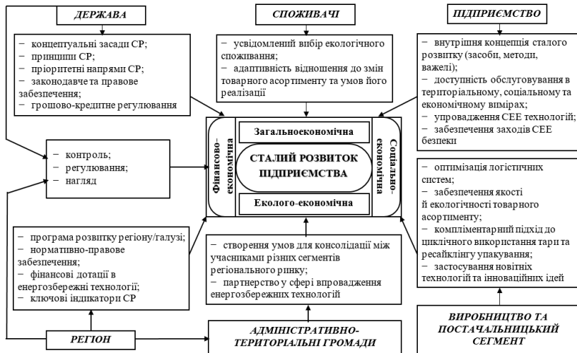
Рис. 3. Композиція інституційного забезпечення формування економічного механізму сталого розвитку торговельного підприємства

5. Згідно з постановленою метою формування економічного механізму забезпечення сталого розвитку підприємств торгівлі визначено пріоритетні напрями дії механізму (екологічність і якість товарного асортименту; зростання показників рентабельності, фінансової стійкості, кредитоспроможності; оптимізація логістично-постачальницьких каналів та зменшення транспортних витрат; зміцнення конкурентних позицій підприємства; зростання рівня економічної, екологічної безпеки та соціального захисту) як поточні цільові орієнтири та стратегічні інтенти (переорієнтація підприємства на принципи сталого розвитку; визначення стратегічних цілей; стимулювання динаміки розвитку; збалансованість СЕЕ системи; нарощування потенціалу СЕЕ системи) як перспективні цільові орієнтири концепції.