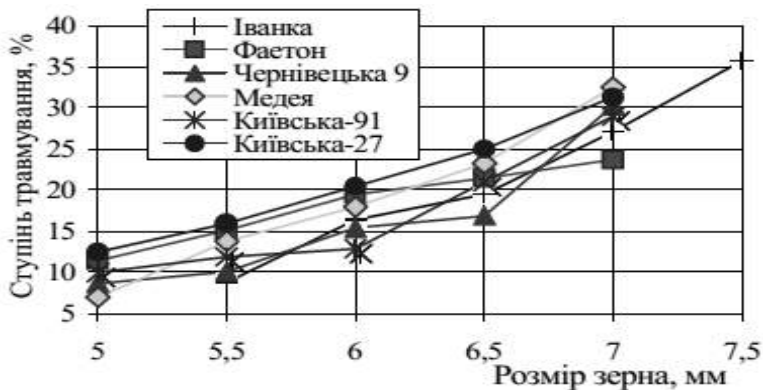
Рис. 2. Ступінь травмування різних фракцій зерен ячменю залежно від сорту

Процеси миття зерна зумовлюють руйнування зернівки з мікро- і макротріщинами оболонки на дві сім'ядолі, що викликало необхідність дослідити залежність ступеню травмування насінневої оболонки різних сортів ячменю від гранулометричного складу.