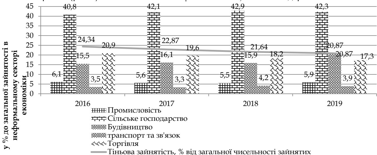
Рис. 4. Рівень зайнятості населення в неформальному секторі економіки за видами економічної діяльності в Україні за 2016-2019 рр.

попереднім періодом, в 2019 році простежується позитивна динаміка до її зниження на 0,77 в. п. до 20,87% від сукупної чисельності зайнятого суспільства в державі.