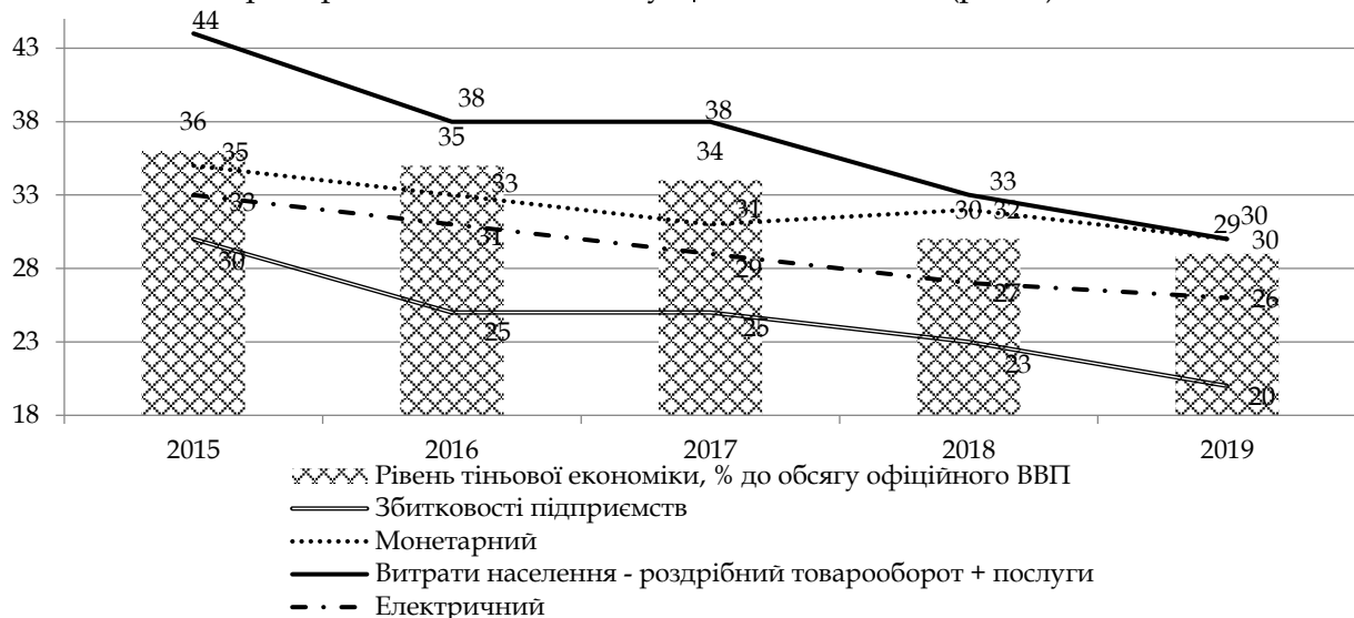
Рис. 2. Динаміка рівня тіньової економіки, розрахованого згідно з різними методиками, відсотки від обсягу офіційного ВВП.

забезпечення безпеки економіки бізнесу. Відтак, значна тінізація в період кризи 2008-2009 рр. здійснювала певний дестабілізуючу дію на економіку України, прискорюючи негативні дії в економіці та протягом 2010-2020 рр. під час завершення гострої стадії кризи менше половини даної частини бізнесу повернулися до легальної діяльності, що при оптимістичному прогнозуванні повинно відбутися і в 2021-2022 рр. Відтак після гострого періоду кризи у 2013-2014 рр. в державі схожий сценарій не було реалізовано, в результаті продовження на постійній основі локальних боїв та воєнної агресії на території сходу України. Але дані, одержані при різних методах обчислення рівня прихованої економіки, чітко показують поведінку деяких учасників ринку в різноманітних складових національної економіки (рис. 2).