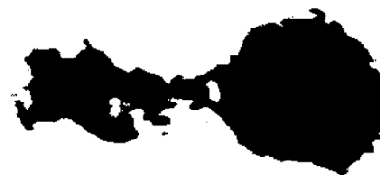
Рис. 2. Мікрофотозображення нейтрофільного гранулоцита з ознаками формування NETs ( \times 2500 ), фарбування за власною методикою