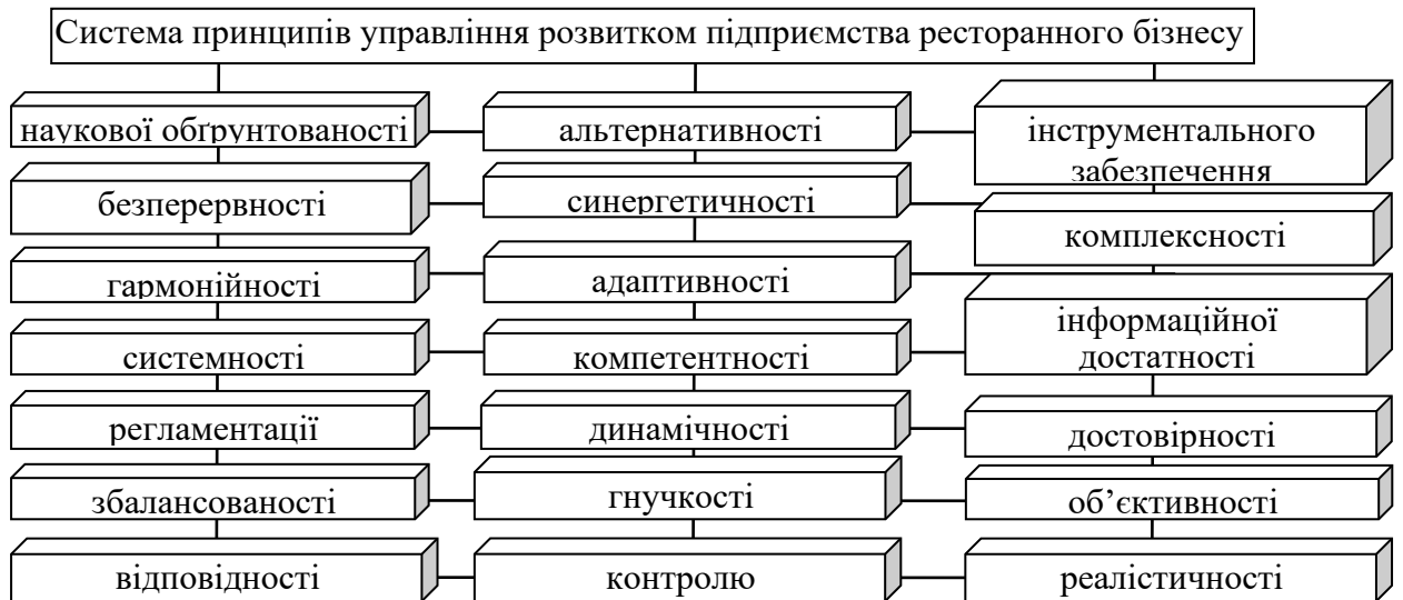
Рис. 1. Принципи управління розвитком підприємства ресторанного бізнесу (сформовано автором)

– принцип наукової обґрунтованості – основний принцип в системі загальних принципів управління, що передбачає комплексний підхід до вивчення всієї сукупності факторів, що впливають на розвиток підприємства ресторанного бізнесу з подальшим застосуванням отриманих знань у практичній діяльності;