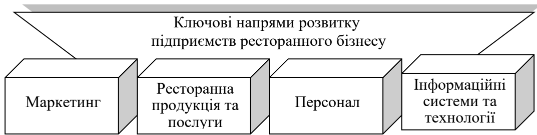
Рис. 3. Ключові напрями розвитку підприємств ресторанного бізнесу

інструменту їх антикризового розвитку) та інформаційних систем та технологій з метою адресної взаємодії з цільовими сегментами ринку.