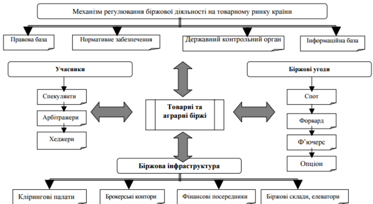
Рис. 1. Організаційно-економічна структура біржової діяльності на товарному ринку

Розгляд сучасної адаптаційної моделі регулювання біржової діяльності на ринку товарної продукції в Україні свідчить, що ця сфера діяльності нині може мати структурний вигляд, який схематично відображений на рис. 1.1.