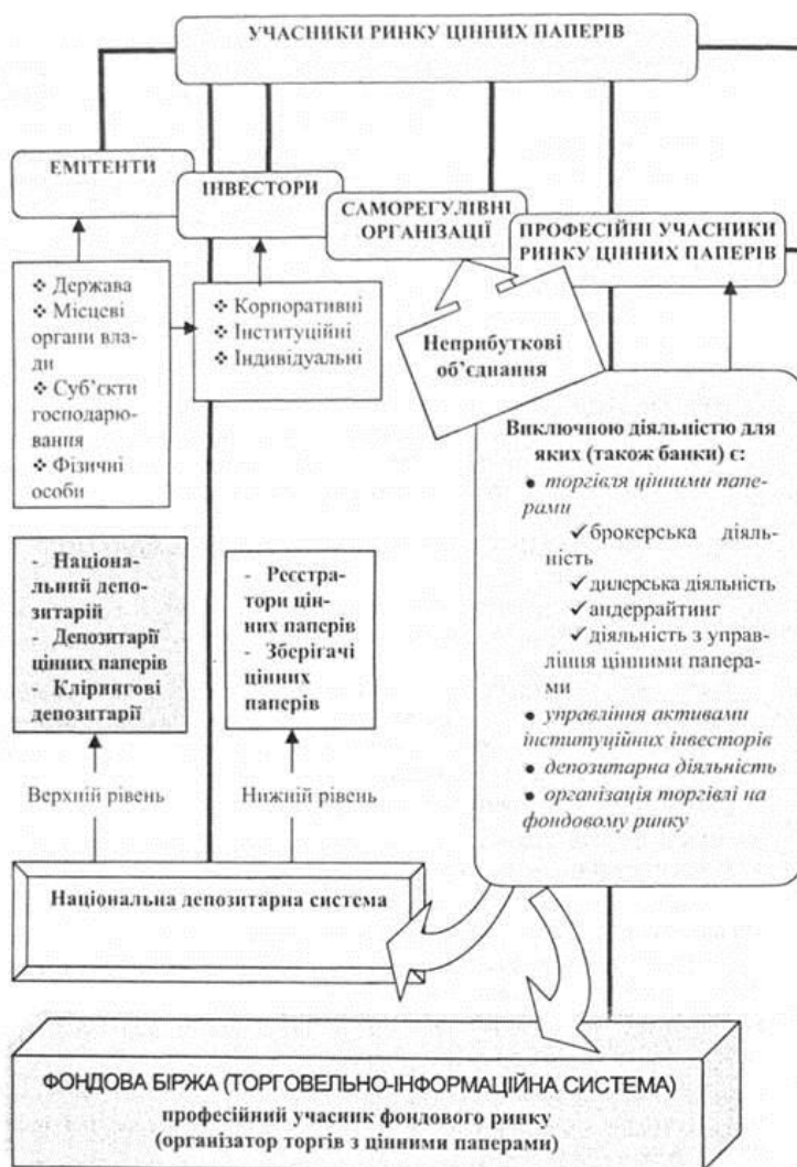
Рис. 2. Учасники ринку цінних паперів

Групу побічних учасників фондового ринку можна представити як: