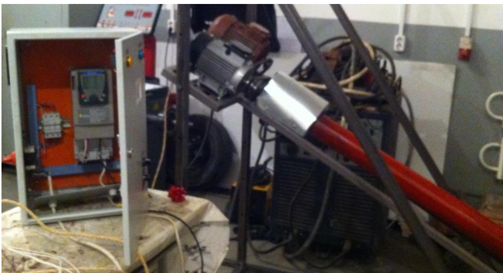
Рис. 1 – Загальний вигляд експериментальної установки

На основі проведеного патентного пошуку, аналізу наукових літературних джерел і проведеного синтезу [6] нами розроблено і запатентовано ряд конструкцій гвинтових конвеєрів з обертовими кожухами. На базі них спроектовано і виготовлено експериментальну установку, загальний вигляд якої представлено на рисунку 1, де окремими електродвигунами приводились в рух гвинтовий робочий орган і кожух (гвинтовий робочий орган – електродвигун потужністю 2,2 кВт; кожух – електродвигун потужністю 1,5 кВт). На цій установці було проведено ряд експериментальних досліджень [7].