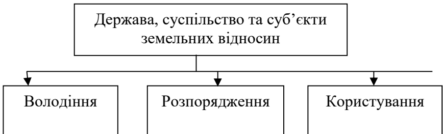
Рис. 2.1. Земельні відносини