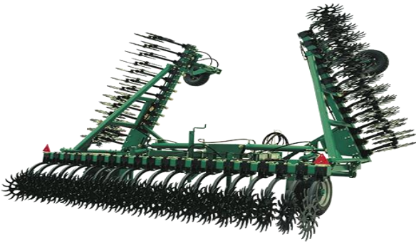
Рис. 4. Борона ротаційна БРП-9,7 («Технополь»)

Ротаційні борони Antoks (рис. 5), ТОВ «Агромаш-Калина» (м. Калинівка Вінницької області) мають різну ширину захвату – 6, 9 та 14 м, агрегуються з тракторами потужністю 80 і 110 к. с. Борона цієї марки сконструйована за схемою підпружиненого хитного важеля. Гнучкість важеля забезпечує пружина, яка чинить тиск на ґрунт за допомогою двох зубчастих коліс. У конструкції борони передбачено регулювання відстані між рядами. Кількість робочих органів ротаційної борони Antoks-9 становить 45 шт. Робоча швидкість – до 15 км/год, продуктивність роботи сягає 15 га/год. Особливістю конструкції 14-метрової борони Antoks є те, що вона складається з центральної секції робочих органів та двох бічних 6-метрових секцій, оснащених системою навіски, які за потреби можна використувати самостійно.