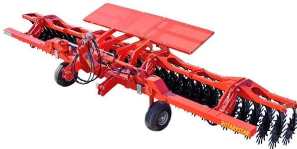
Рис. 7. Ротаційний культиватор Rotarystar (Австрійська фірма Einboöck)

Австрійська фірма Einboöck пропонує українським сільгоспвиробникам ротаційні культиватори Rotarystar 300 та Rotarystar 600 (рис. 7), які агрегатуються із тракторами потужністю 70 і 120 к. с. відповідно. Руйнування монолітної ґрунтової кірки після дощу забезпечують робочі органи — зірочки діаметром 52 см із 16-ма змінними пальцями. На центральній рамі передбачений захист від каміння. Виробник декларує робочу швидкість борони до 25 км/год, що може забезпечити високопродуктивний обробіток ґрунту, однак, на нашу думку, такий параметр має бути ретельно досліджений. Додатковою функцією Rotarystar є встановлення на бороні висівного апарата, що дає змогу водночас із виконанням розпушування ґрунту проводити висівання різних видів культур та їхнє загортання.