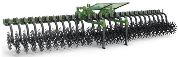
Рис. 6. Борона ротаційна Green Star (ТОВ «Аверс-Агро» «Агромаш-Калина»)

Поворотом борони на 180° у горизонтальній площині можна забезпечити різну активність її дії на ґрунт та рослини.