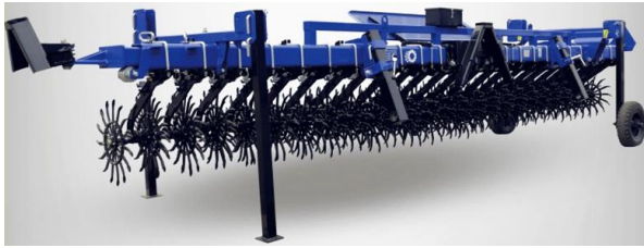
Рис. 2. Борона-мотика БР-6, виробництва ТОВ «Оріхівсільмаш»

Ротаційні борони – це сільськогосподарські машини, що призначені для до- та післясходо-вого боронування посівів польових культур (в т.ч. і просяних та технічних) для поверхневого розпушування та аерації ґрунту, знищення ниткоподібних сходів бур'янів [9].