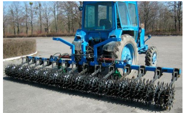
Рис. 3. Борона зубова міжрядна БЗМ-5,6, «Хмільниксільмаш»

вітчизняні компанії, хоча, звісно, є також і техніка закордонного виробництва. Зокрема, борона зубова міжрядна БЗМ-5,6, «Хмільниксільмаш» (рис. 3) призначена для обробки просяних культур буряків, соняшнику, кукурудзи із шириною міжрядь 45; 60; 70 см та для суцільного обробки ґрунту з метою: подрібнення ґрунту перед висівом; вирівнювання поверхні поля; руйнування ґрунтової кірки; проріджування озимих посівів обробкою уперек рядків