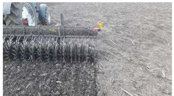
Рис. 8. Ротаційна борона Yetter (Фірма Yetter (США))

Цієї відстані достатньо для того, щоб залишити поза робочими органами бур'ян в стані нитки і, залишивши його на полі, надати йому можливість для подальшого укорінення.