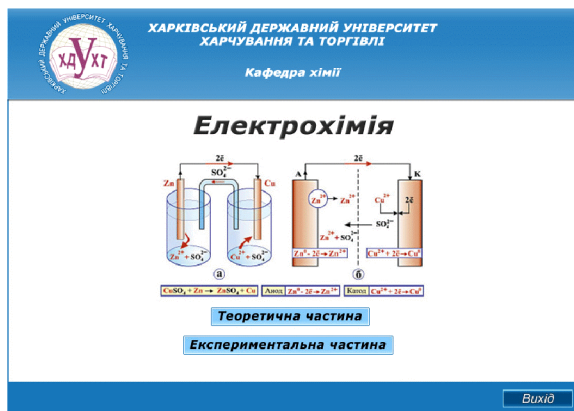
Рисунок 1 – Титульна сторінка електронного практикуму

Традиційна форма виконання лабораторної роботи “Визначення електрорушійної сили електрохімічних елементів” передбачає після проведення експерименту обробку результатів дослідження студентами власноруч, що займає багато часу. Необхідно використовувати цілий комплекс громіздких формул, у яких студенти в результаті неухважності роблять багато помилок. Процес розрахунків сильно затягується, в результаті чого, залишається мало часу для закріплення матеріалу і перевірки засвоєних знань у студентів.