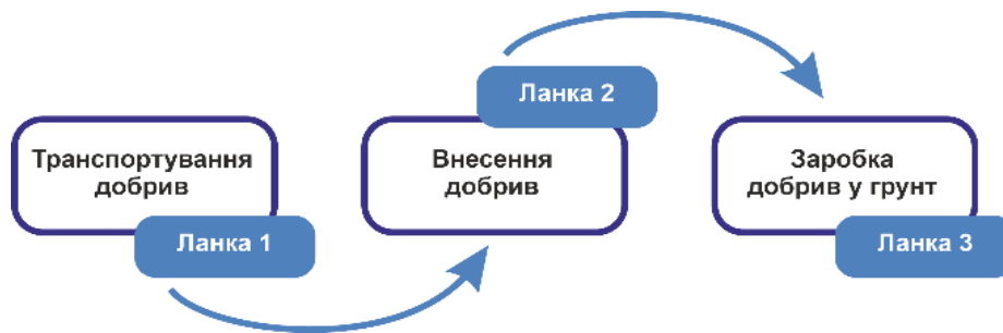
Рис. 7. Оптимальна модель послідовності циклу взаємопов'язаних операцій

Робочий день приймаємо двозмінний, тобто 14 годин, це позначено у стовбці А. Заносимо у таблицю, стовбці С та Е, чистий час роботи у продовж години роботи агрегатів для внесення мінеральних добрив (Рис. 8).