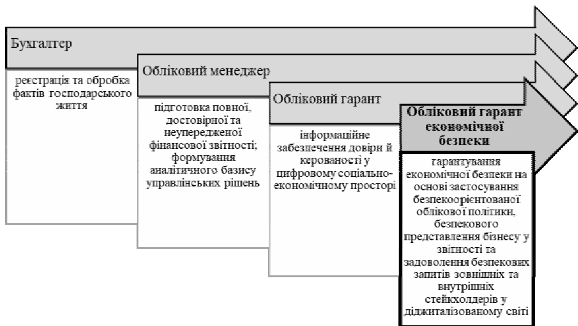
Рис. 3. Еволюційна трансформація назви та місії професії бухгалтера в діджиталізованому світі

Попередній аналіз досвіду практичної діяльності головних бухгалтерів та керівників економічних підрозділів підприємств, здійснений на основі всеукраїнського експертного опитування протягом 2019–2020 рр., дозволив сформулювати висновок про необхідність запровадження введення в професійне бухгалтерське середовище нової якості «гарант» – комплексу заходів та особистих професійних якостей фахівця, що дають змогу досягати кінцевої мети через задоволення інформаційних запитів і досягнення довіри, порозуміння та керуваності в цифровому світі. З урахуванням згаданих вище позицій вважаємо за доцільне розглядати назву професії бухгалтера з погляду її трансформації в «облікового гаранта економічної безпеки», що пов'язано з включенням економічної безпеки до об'єктного складу бухгалтерського обліку та її надважливою можливістю створювати основу для сталого розвитку підприємств (рис. 3).