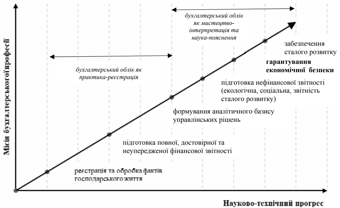
Рис. 2. Еволюційна трансформація місії бухгалтерського обліку та професії бухгалтера під впливом науково-технічного прогресу

Попередній аналіз досвіду практичної діяльності головних бухгалтерів та керівників економічних підрозділів підприємств, здійснений на основі всеукраїнського експертного опитування протягом 2019–2020 рр., дозволив сформулювати висновок про необхідність запровадження введення в професійне бухгалтерське середовище нової якості «гарант» – комплексу заходів та особистих професійних якостей фахівця, що дають змогу досягати кінцевої мети через задоволення інформаційних запитів і досягнення довіри, порозуміння та керуваності в цифровому світі. З урахуванням згаданих вище позицій вважаємо за доцільне розглядати назву професії бухгалтера з погляду її трансформації в «облікового гаранта економічної безпеки», що пов'язано з включенням економічної безпеки до об'єктного складу бухгалтерського обліку та її надважливою можливістю створювати основу для сталого розвитку підприємств (рис. 3).