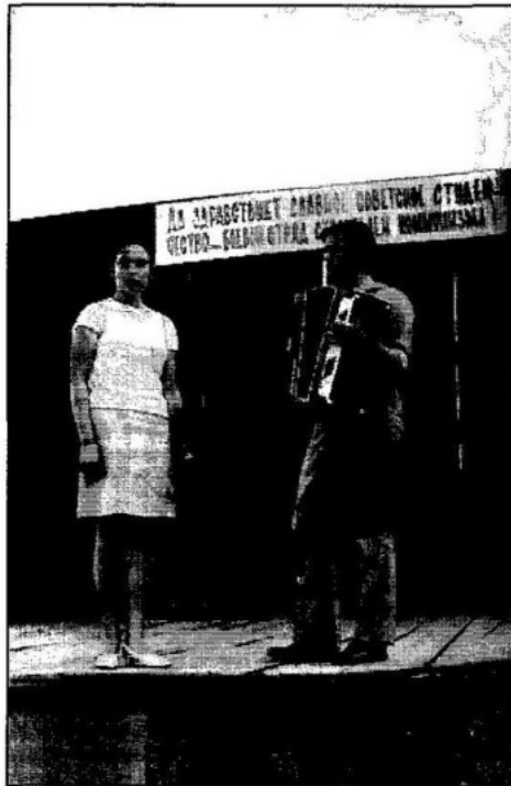
Участь у художній самодіяльності в студентському будівельному загоні Харківського сільськогосподарського інституту ім. В.В. Докучаєва, 1974 р.