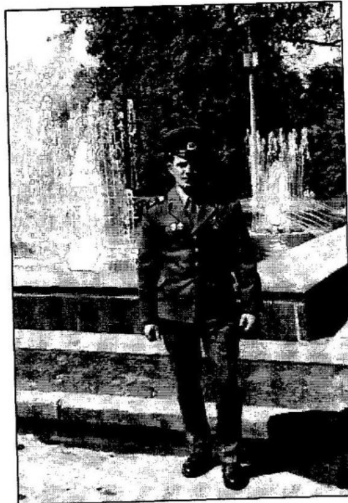
Повернення з лав Радянської Армії. Харків, 1979 р.