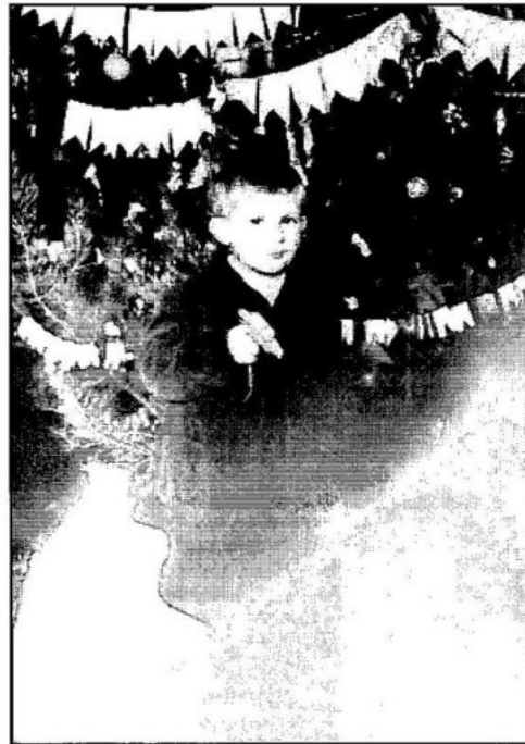
Свято Нового року, 1956 р.