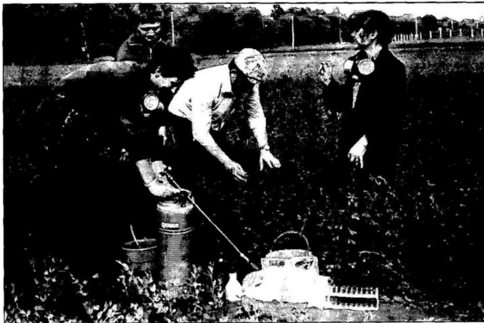
Студенти-дипломники факультету захисту рослин готуються до проведення захисних заходів на посівах насінневої люцерни. Дослідне поле Харківського сільськогосподарського інституту ім. В.В. Докучаєва, 1986 р.