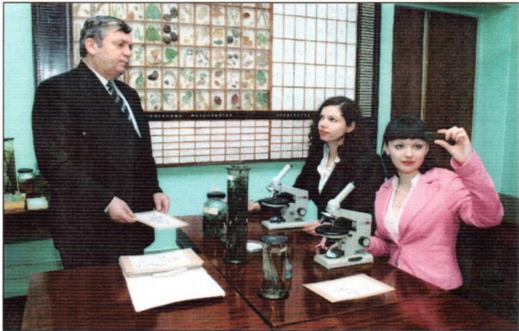
Заняття зі спеціалістами зовнішнього та внутрішнього карантину рослин України проводить завідувач кафедри фітопатології професор В.П. Туренко, 2010 р.