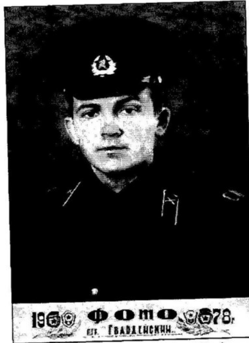
Служба в лавах Радянської Армії. Навчальний підрозділ сержантської школи, смт «Гвардейский» Джамбульської області Казахської РСР, 1977 р.