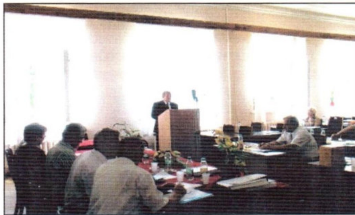
Захист докторської дисертації на тему «Грибні хвороби насінневої люцерни, прогноз їх розвитку у Східному Лісостепу і Степу України» у спеціалізованій вченій раді Д 26.004.02 у Національному аграрному університеті, м. Київ, 2006 р.