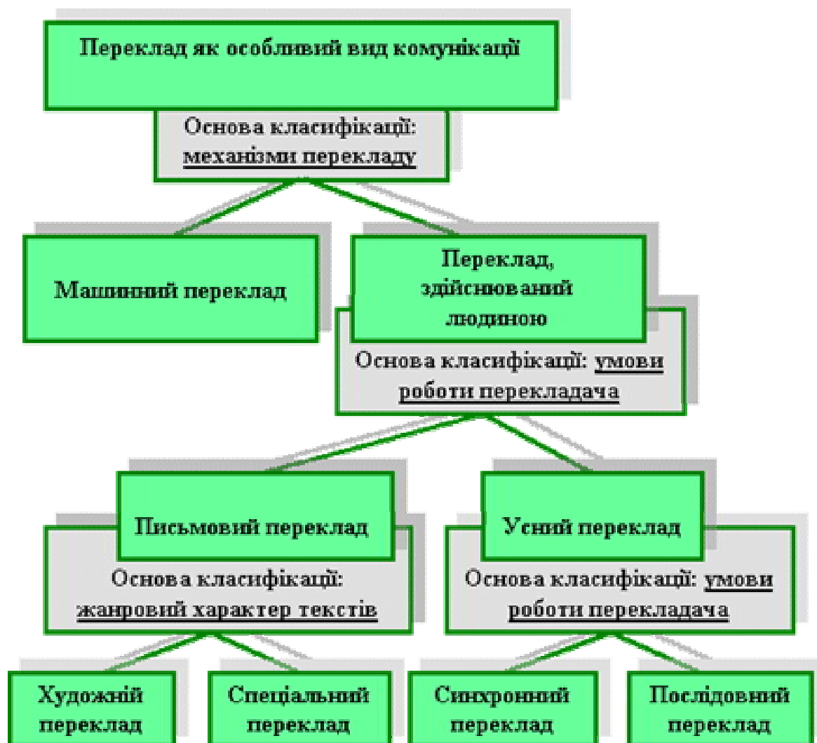
Рисунок 1 – Послідовний поділ перекладу

Таким чином, науці про переклад необхідно мати загальну теорію перекладу, яка охоплює все те, що є типовим для будь-якого виду комунікації з використанням двох мов. Науці про переклад важливо мати теорії перекладу, побудовані на специфіці машинного, усного, художнього і спеціального перекладу. Послідовний поділ перекладу, що враховує найсуттєвіші відмінності в самому процесі перекладу, можна представити у вигляді схеми (рис. 1).