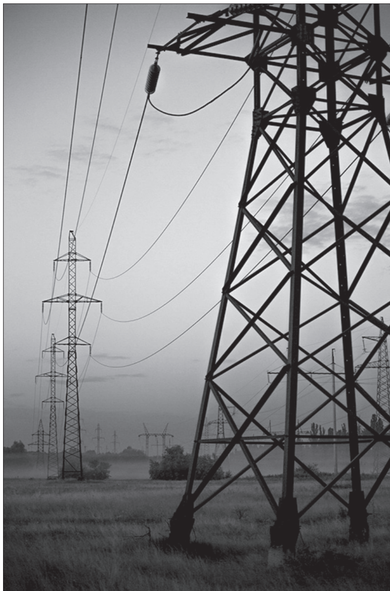
Земля в тенетах медиа