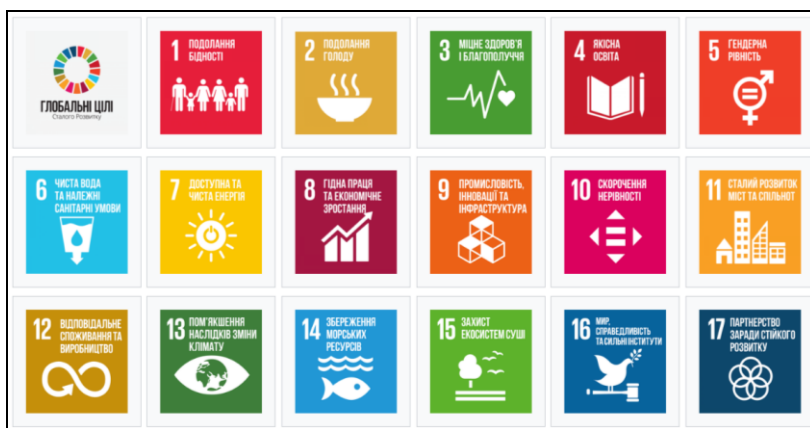
Рис. 1. Цілі сталого розвитку [8]

відбувся 25-27 вересня 2015 р. у Нью-Йорку. Основні темою для обговорення став Порядок денний «Період після 2015 року» і документ «Цілі сталого розвитку». Основними елементами для Порядку денного було визначено – гідність, люди, процвітання, планета, справедливість і партнерство. Новий Порядок денний передбачає до 2030 року викоринити злиденність і повсюдно сприяти економічному процвітання, соціальному розвитку, охороні довкілля. Затверджені на Саміті цілі сталого розвитку є комплексними, взаємопов’язаними і неподільними цілями людства і демонструють всевітній характер. 17 Цілей та 169 проміжних завдань націлені на усунення основних системних перешкод на шляху до сталого розвитку, у тому числі нерівності, нестійкого споживання і виробництва, відсутності належної інфраструктури та гідної роботи (рис. 1).