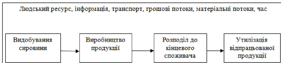
Рис. 1 – Лінійне представлення ресурсоспоживання

В даний час частіше використовується лінійне ресурсоспоживання. Тобто технології відновлення ресурсів розроблені та використовуються не в повній мірі.