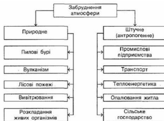
Рис. 3 – Схема забруднення атмосфери [13]

Раціональна маршрутизація, ефективно обрані транспортні засоби для транспортування вантажів, узгодження роботи навантажувально-розвантажувальних механізмів та автомобілів в розподільчих центрах, терміналах значно впливають на економію такого ресурсу, як час, та скорочують витрати на доставку та зберігання вантажів.