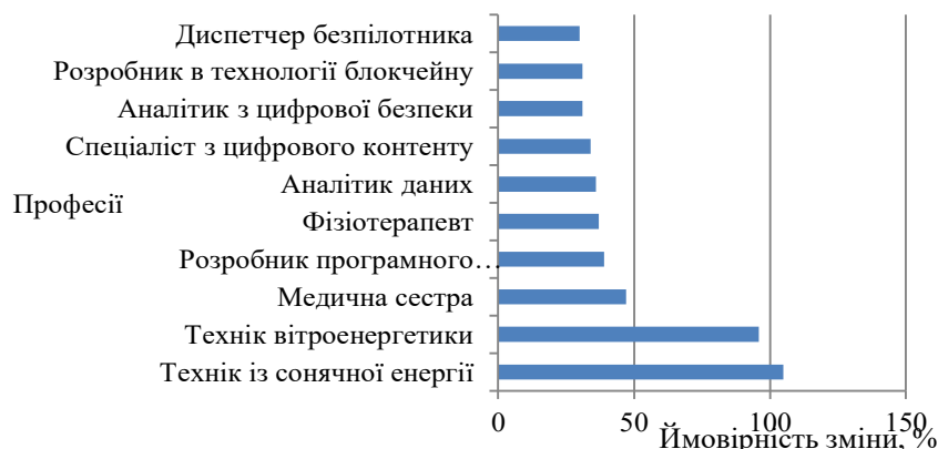
Рис. 1. Професії, попит на які буде високий у майбутньому (за версією « Trade Schools Colleges Universities »)

галузеву спеціалізацію. Професії майбутнього за версією « Trade Schools Colleges Universities » наведено на рис. 1.